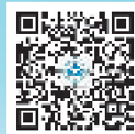
招生办公众号二维码