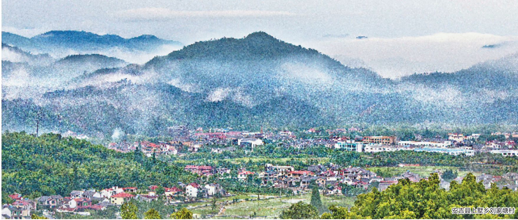
安吉县止墅乡刘家塘村

“千村示范、万村整治”工程(以下简称“千万工程”)是时任浙江省委书记习近平同志亲自谋划和推动实施的一项创新工程。历届浙江省委、省政府坚持一张蓝图绘到底、一任接着任,不断深化“千万工程”。党的十八大以来,习近平总书记站在引领中国“三农”发展的宏观高度,对浙江“千万工程”作出多次批示。中共中央办公厅、国务院办公厅专门发文,要求在全国推广浙江“千万工程”经验做法,并在全国开展农村人居环境整治行动,使浙江这项民生工程转化为推动中国乡村振兴的一项战略工程,为改变整个中国农村面貌,促进中国生态环境建设作出了巨大贡献。这项工程还在2018年获得联合国“地球卫士奖”。可以说,“千万工程”历久弥新,具有全国和世界意义,成为一项改写当代中国“三农”历史的伟大工程。