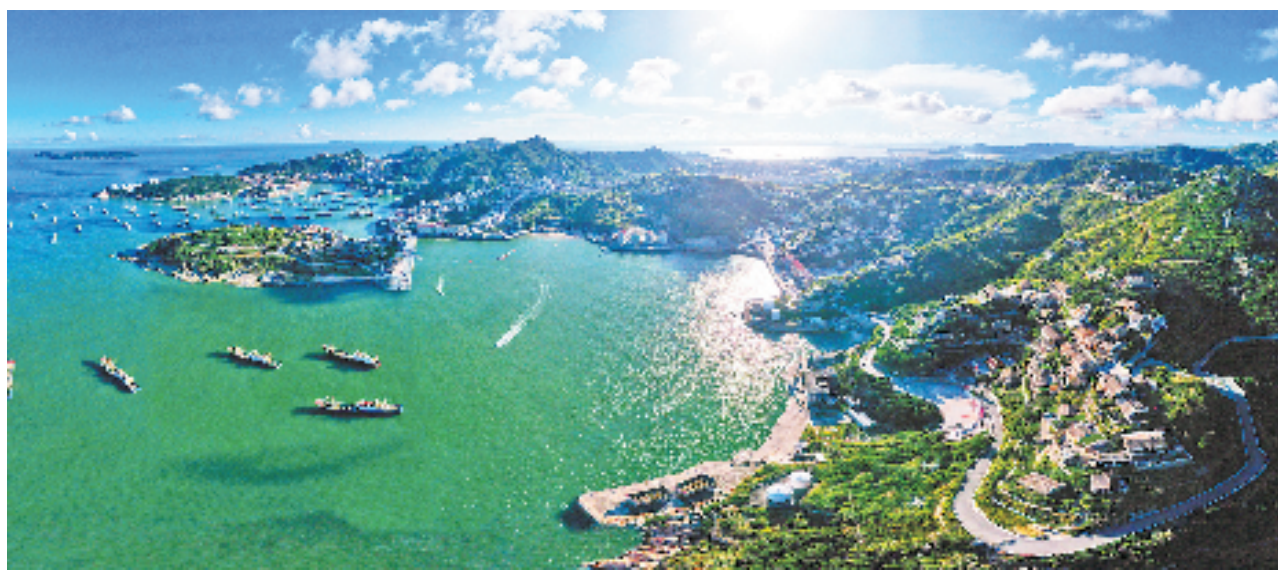
石塘海岸