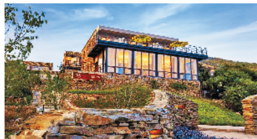
蝶来·日出三舍民宿