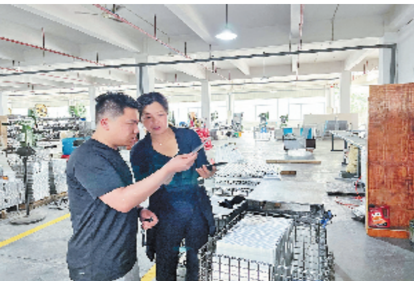
寿昌镇干部进企业走访，了解企业生产经营情况

平安护航永远在路上。下一步，寿昌镇将围绕杭州亚运会安保工作，开展镇专班、联村(社)组、行政村和网格“四级摸排”，拓宽排查隐患广度和深度，按照矛盾纠纷的轻重缓急程度，划分为红、橙、黄、蓝进行“四色管控”，提高防范风险强度，增强化解矛盾力度，做到“小事网格办，大事村里议，难题镇里管”，强化党建统领网格智治，筑牢共治共享根基，为社会治理注入新鲜活力，为现代化美丽城镇建设、城乡风貌整治提升创新经验，不断增强人民群众的安全感、幸福感和获得感，让群众切身感受社会治理成效。