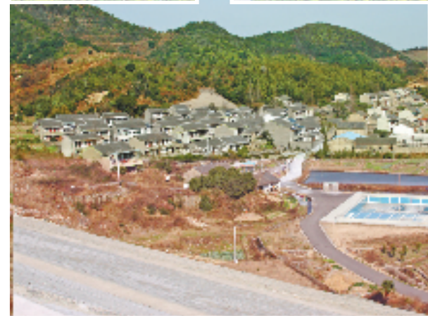
2007年的新建村

舟山市定海区新建村,是一个藏在深山冷岙里的海岛村。从舟山跨海大桥下来,我还担心找不着地方,想着一路向东问过去。当地百姓却说,放心,新建是个一眼就能认得出的好地方。