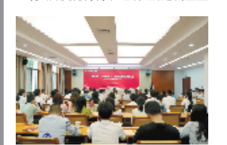
婺城区举办“婺选优才”培养工程启动仪式暨选调生基层履职擂台赛

“青春由磨砺而出彩,人生因奋斗而升华。我将继续在这片充满希望的八婺大地上挥洒青春汗水……”近日,在金华市婺城区“婺选优才”培养工程启动仪式暨选调生基层履职擂台赛上,罗店镇鹿村书记助理、选调生王