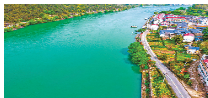
丽水市石塘镇滩下村路域环境整体提升,2022年村集体收入达到36万元,村民人均收入3.08万元,实现了建村道、活产业、富村庄的良性循环。

乡村道路上一份保险,乡村振兴多一份保障。大美丽水,“四好农村路”正串起绿水青山中的幸福生活。