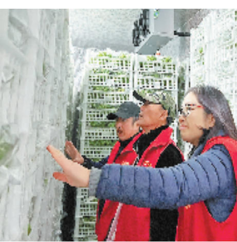
长兴画溪街道曹家桥乡贤会出资打造葡萄基地“同心共享冷库”。

“新乡贤是推动农村共同富裕的重要力量,通过打造乡贤助力共富示范带的形式,我们有效凝聚了各乡镇、街道的新乡贤力量,形成了与当地资源禀赋、发展需求高度契合的新乡贤助力工作体系,同时也为‘能人返乡、人才回