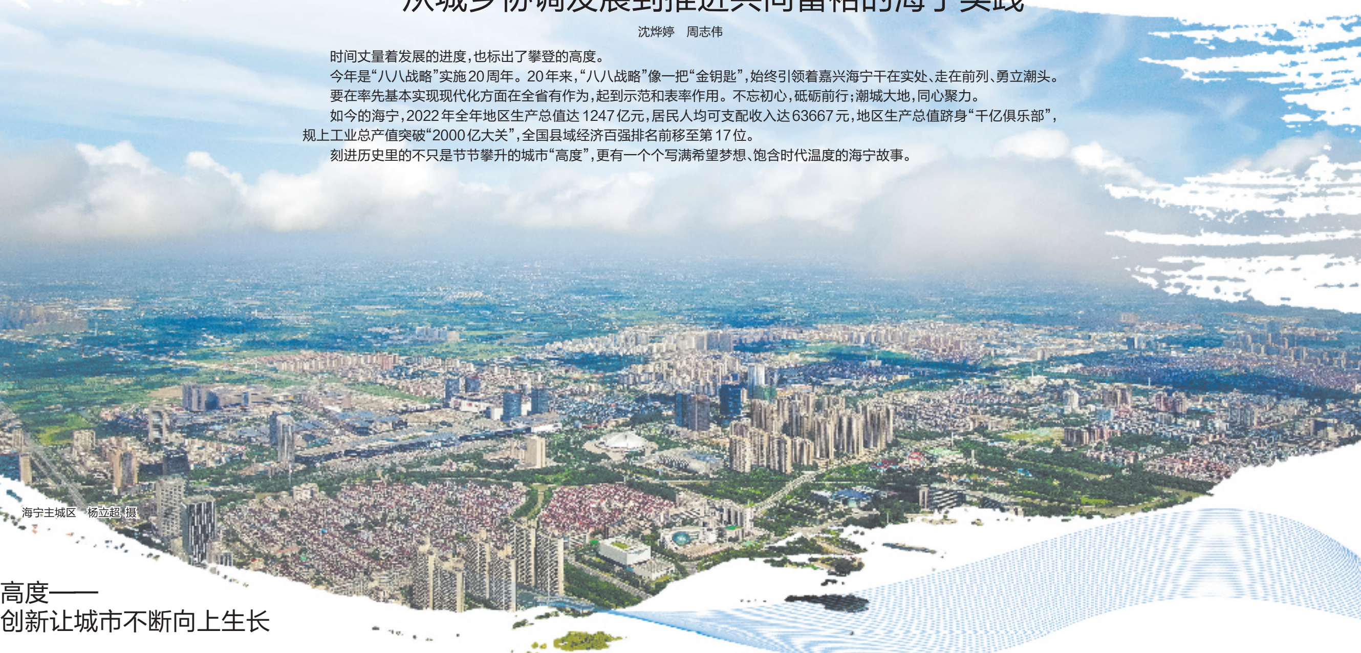
海宁主城区

时间丈量着发展的进度,也标出了攀登的高度。今年是“八八战略”实施20周年。20年来,“八八战略”像一把“金钥匙”,始终引领着嘉兴海宁干在实处、走在前列、勇立潮头。要在率先基本实现现代化方面在全省有作为,起到示范和表率作用。不忘初心,砥砺前行;潮城大地,同心聚力。如今的海宁,2022年全年地区生产总值达1247亿元,居民人均可支配收入达63667元,地区生产总值跻身“千亿俱乐部”,规模以上工业总产值突破“2000亿大关”,全国县域经济百强排名前移至第17位。刻进历史里的不只是节节攀升的城市“高度”,更有一个个写满希望梦想、饱含时代温度的海宁故事。