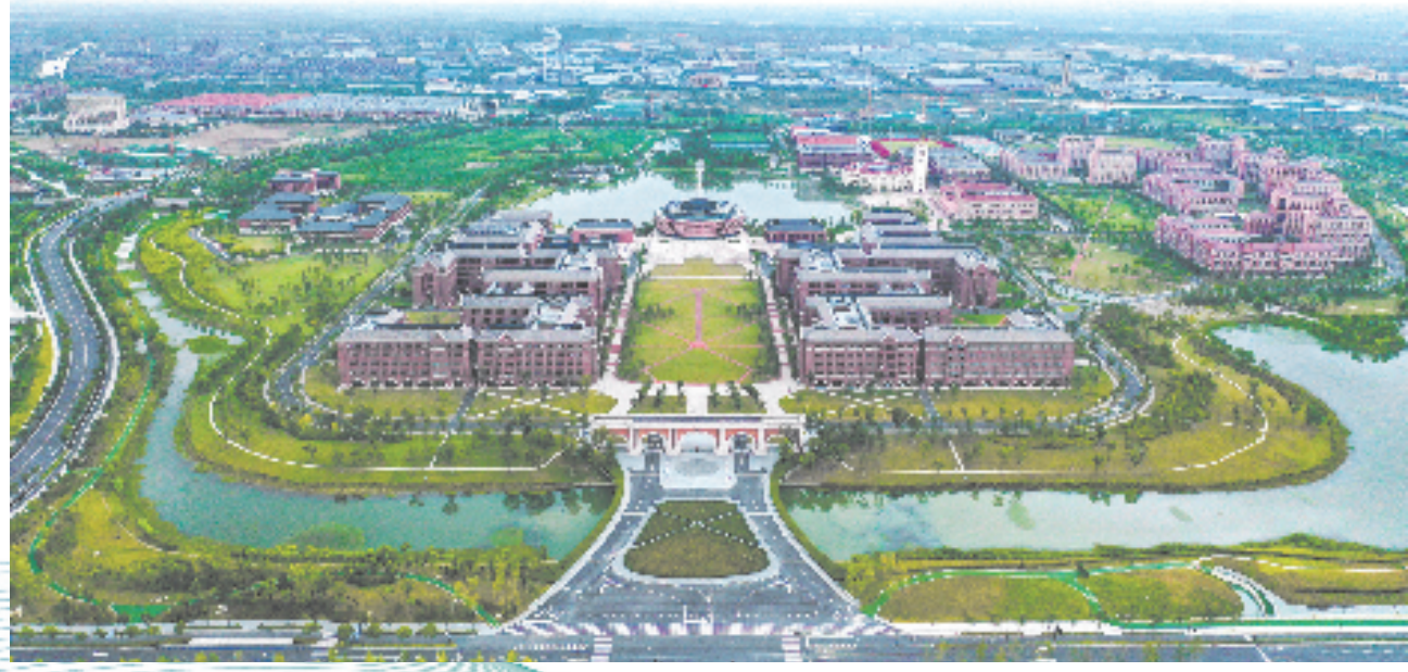
浙江大学国际联合学院(浙江大学海宁国际校区)

“弄潮儿向涛头立,手把红旗旗不湿”。放眼新征程,海宁将以“八八战略”实施20周年为契机,吹响新的号角,坚定不移、忠实践行,奋进谱写中国式现代化海宁新篇章、勇当高质量发展建设共同富裕示范表率的新征程。