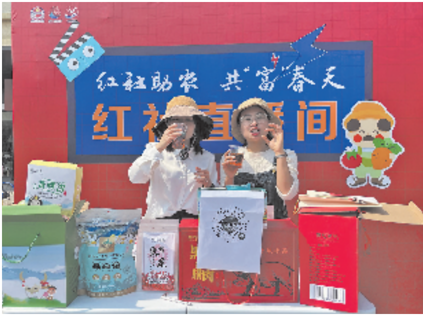
运河公益星期六系列活动之“红社助农 共富春天”运河共富集市

下一步，长安镇将依托全市首家镇级共富工坊服务中心的启用，以“潮城共富工坊”应用场景为平台，在村务虚拟工坊、择业技能提升等方面再探索，持续深化党群创业共富工程。