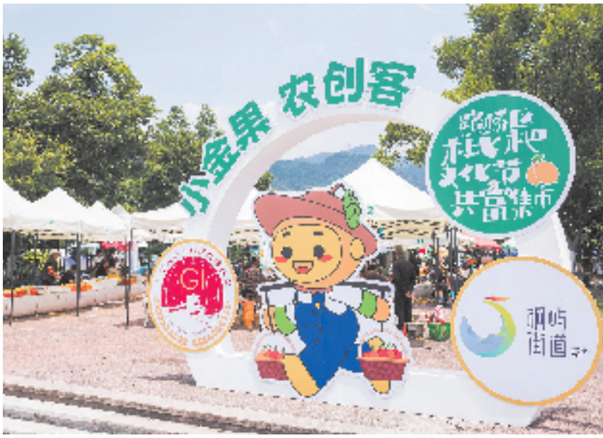
路桥枇杷文化节共富集市促进农旅产业融合发展

设立“助富物流”。针对农产品保存期短、运输成本高等难题，依托快递行业联合党委，整合13家快递物流公司及42个网点，实现三级物流快递网络全覆盖，快递进村率100%。推出“红色助农物流”、“大企牵小企”物流，与村社签订