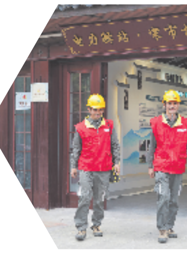
在德清县新市镇宋市村，国网德清供电公司“村网共建”模式推进红船光明电力驿站建设，赋能乡村共同富裕。

5月23日，在湖州市德清县新市镇句城村，村委会屋顶的太阳能光伏板在阳光下熠熠生辉。光伏电站并网后发出的清洁电通过绿电聚合的模式输送至第19届杭州亚运会比赛场馆之一的德清地理信息小镇篮球场，为场馆照明、通风等注入绿色动能。