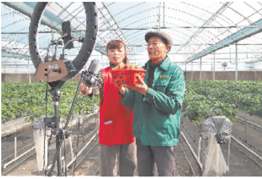
果农在百花“共富工坊”红管家的协助下于“大棚共享直播间”进行直播