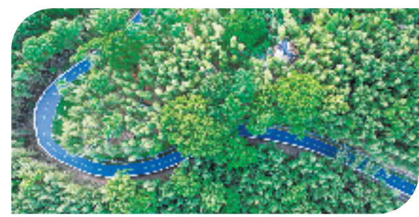
丛林穿越

正如五山水利工程自始至终坚持的建设理念：以民为本、系统创新、求真务实、铸就卓越，实现安民惠民富民。