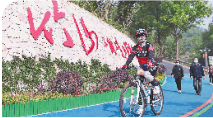
不能不走的英雄路