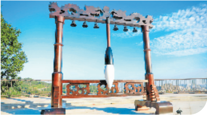
文笔春秋