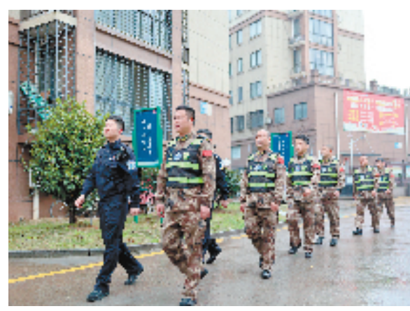
龙游县公安局深化“警务融治”工作，打造义警队伍，常态化开展治安巡逻，构建群防群治“前哨”。图为龙游县三衢义警东华大队在东华街道兰桂庭小区巡逻。

树“亲清”清风，展清廉形象。今年，江山市开展商会大走访大宣传活动，为企业家发放了《江山市政商交往正负面清单》。为畅通政企对话渠道，2022年以来，江山市共开设亲清茶叙会、“亲清直通车·政企协商会”、“亲清连心万里行”等25期，党委政府主要领导带头面对面对话市内外企业家300多人，收集并交办问题建议共253个，着力构建亲清政商关系。