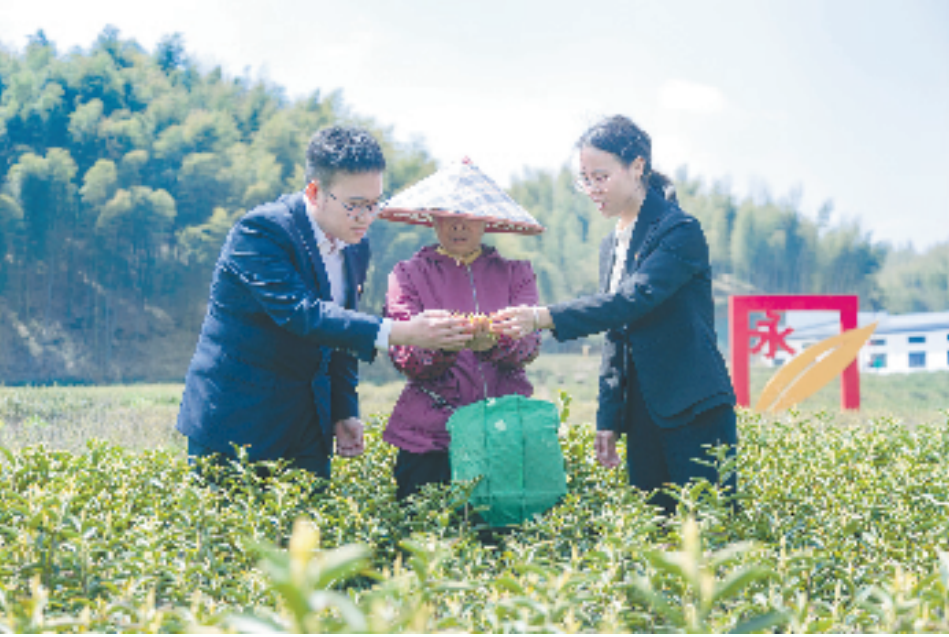
龙游县纪委监委运用“1+2”片区协作联动机制，聚焦茶产业惠农资金使用情况开展专项监督，严肃查处群众反映的截留挪用、冒领私分、套取骗取茶农补贴资金以及党员干部在服务保障春茶生产工作中存在的履职不力、敷衍塞责等问题，全面压实职能部门监管责任和乡镇街道属地责任，提升为农服务水平，护航茶产业高质量发展。图为龙游县纪委监委驻县委宣传部纪检监察组开展专项监督调研。

“下一步，我们将继续发挥好我们党建联建带动产业发展的制度优势，不断优化创业环境，吸引更多优秀乡贤回乡创业，带动当地老百姓奔向共同富裕的美好愿景。”湖镇镇党委主要负责人士表示。