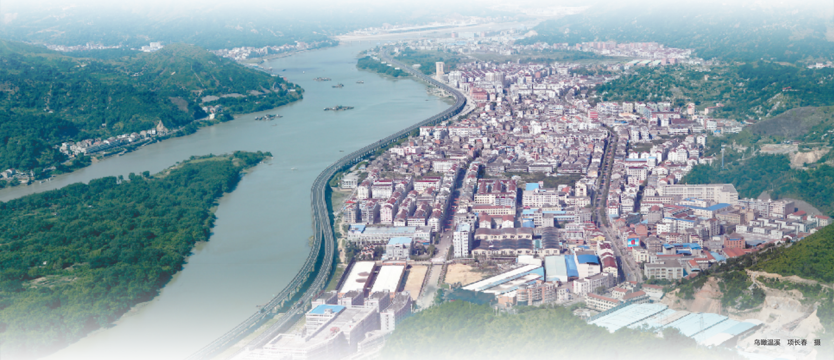
鸟瞰温溪

瓯江之畔，山水之间，江南榕堤，绿意盎然。这里是历史悠久的千年古镇，这里是向绿而行的工业强镇，这里是跨山问海的华侨大镇。丽水市青田县温溪镇，这座现代化滨江新城，立足“一镇三乡”自身发展特色，推动中心镇辐射带动三乡发挥各自地域特色，打造规模化、集聚化产业融合发展新局，获得省级小城市培育试点考核“优秀单位”、美丽城镇建设省级样板、省中小微企业培育突出集体、省级卫生镇等荣誉。绿水青山间，工业强镇环境美出新亮度、产业美出新速度、生活美出新高度，成为绿色生态的区位明珠、人文独特的城镇明珠、实力强劲的工业明珠。