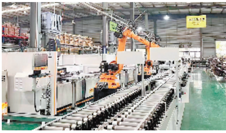
柯勒门窗数字化工厂改造项目