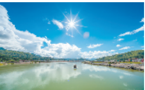
《最美航道》

生态长廊昔日可不是这般模样。原先，古榕树群感染了严重的煤污病，镇里专门邀请丽水市农科院专家为榕树“诊脉开方”，经修剪、药物喷洒等综合救治，让古榕树群得以