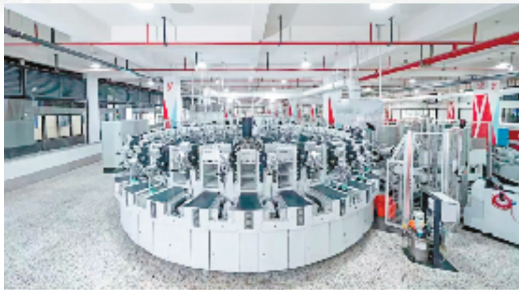
意尔康德士马全自动生产线

作为全县工业发展的主引擎、主战场、主平台，温溪强势推进低效整治，抓好低效用地连片整治，加快推动工业用地再开发、园区产业集聚发展和转型升级，有效盘活占地162亩的高耗低效用地，实现连片拓展工业用地500亩以上，为引进百亿级重大项目提供土地要素支撑。