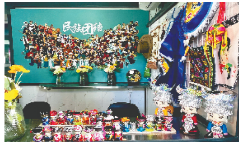
“石榴红驿站”内部

下一步，彭埠街道将充分发挥制度优势，以创新创优为方向，坚持大团结大联合，充分发挥杨柳郡未来社区人本化、生态化、数字化的特色优势，铸牢中华民族共同体意识，促进各民族交往交流交融，谱写同心共筑中国梦新篇章。