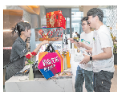
在嘉大学生体验“嘉兴人才码”

公共出行、体育锻炼、图书借阅、商家消费……“一码畅享生活”。自2020年“嘉兴人才码”推出以来，因丰