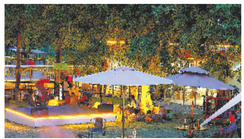
掩映在大山中的民宿，吸引游客纷至沓来。

当前，乡贤基地在促进农民就近稳定就业，提高农民收入方面取得了一定成效。接下来，长湖村还将依托当地红色资源优势，以红色文化带动生态发展，通过乡贤助力，让乡贤基地进入更多产业领域，促进城乡互补，拓展全产业链增值增效空间，确保“人人有事做，家家有收入”，助力泗安镇迈向共同富裕。