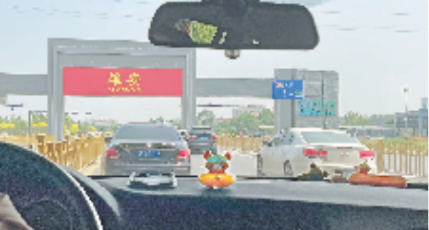
坐落在雄安主干道上的地标“雄安”牌坊。

“口碑是干出来的，其他就交给时间。”开创企业新版图的第一个项目，他们在工地结实实“钉”了6个月。在雄安集团2022年底的综合评价中，万邦从67家造价咨询机构中脱颖而出，成为8家获评优秀的机构之一，让不少人看到了浙江的决心和诚意。