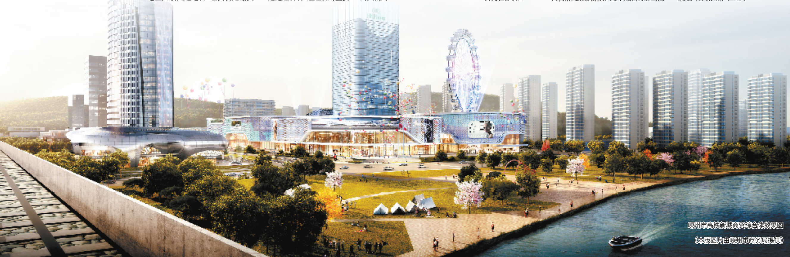
嵊州市高铁新城商贸综合体效果图 (本版图片由嵊州市商务局提供)