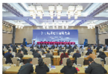
嵊州市双招双引动员大会

根据新发布的《嵊州小吃产业三年行动方案（2023-2025）》，眼下嵊州市还在布局建设嵊州小吃产业园等“十个一”工程，力争到2025年底培育100家小吃企业，实现年产值市外100亿元、市内100亿元“双百亿”目标，推动嵊州小吃全产业链发展。