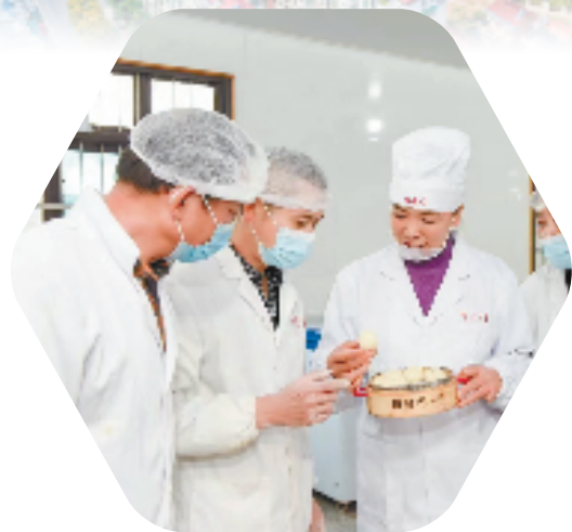
嵊州小笼包企业利用“共富工坊”进行技术培训