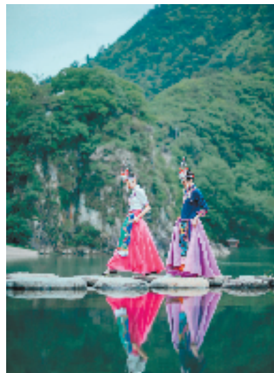
景宁畲族自治县美景