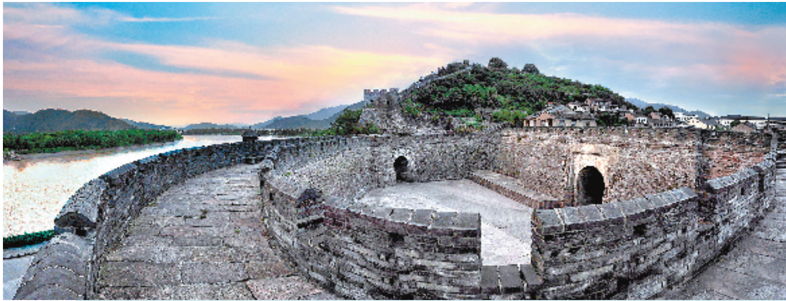
台州府城

新石器时代,这片9411平方公里的陆地上诞生了下汤文明;唐朝时期,400多位文人墨客在此留下了一条彪炳史册的“诗歌长廊”。