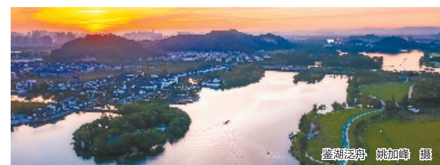
鉴湖泛舟

截至4月底实际完成投资35.58亿元,投资完成率46.61%。2个项目被列入全省文旅投资“双百”项目。跨越时空,古与今在此相遇。从摇着船橹叫卖的“水上布街”,到“布满天下”的“国际纺都”,苍翠大山里飘逸的王坛彩虹栈道,桨声灯影交织的江南安昌古镇,亚运热力喷薄的羊山体育公园……柯桥执“融合”之妙笔,让一个个项目落地开花、一片片空间重塑新生,一路铿锵向前,奔向充满活力的“诗和远方”。