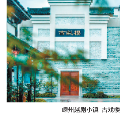
嵊州越剧小镇 古戏楼

的“神经末梢”,深挖地域文化优势,为当地群众解锁全方位高品质的文化生活新方式。壮大风景里的产业,描绘文旅“嵊”景。百年越剧诞生地、千年剡溪唐诗路,嵊州依托“越剧+”“书法+”“唐诗+”,坚持以文“融”旅,以旅“活”文,全力做好文化旅游融合高质量发展文章,推动文化旅游全领域、全方位、全链条深度融合,用“诗与远方”描绘嵊州文旅发展新盛景。