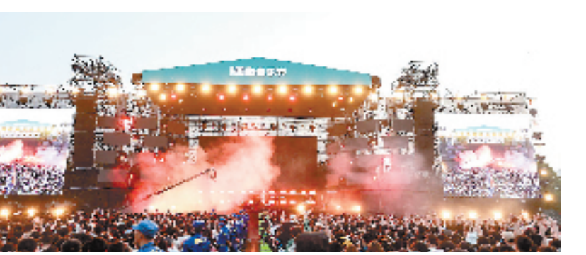
诸暨西施音乐节

诸暨,越国古都、西施故里。文旅融合的创新实践正在这里不断深入推进。聚焦打造长三角健康休闲文化旅游目的地,诸暨市厚植西施文化,深耕资源禀赋,以实施文旅深度融合工程为抓手,加快推进西施故里“一江两岸”、诸暨市文化产业中心建设等一批重大文旅项目,创新打造更多具有引流性、辨识度的文旅产品,不断提升“西施故里 好美诸暨”城市文旅形象影响力,助力文旅赋能共同富裕。截至目前,“西施传说”已被列入首