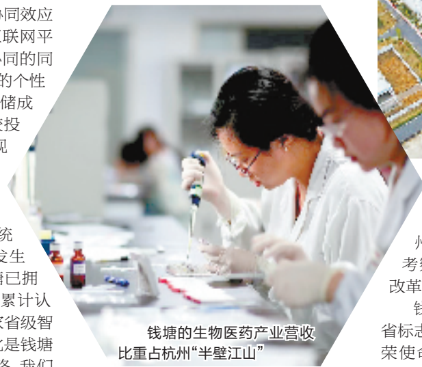
钱塘的生物医药产业营收比重占杭州“半壁江山”

截至目前,钱塘已拥有元宇宙概念关联企业近百家,形成以士兰集成、立昂微为代表的集成电路产业,以壹网壹创、米奥兰特为代表的电子商务及会展企业。根据《2022浙江省数字经济