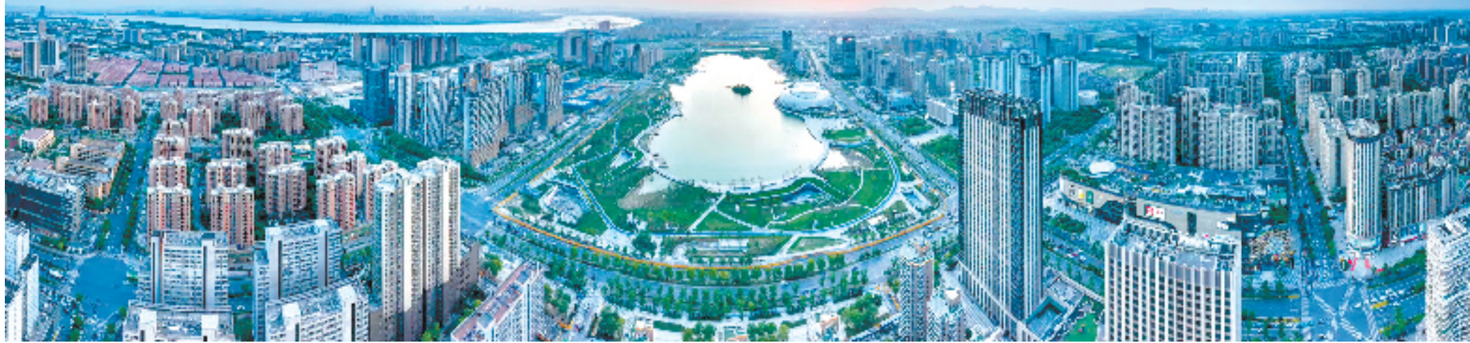
钱塘是浙江的制造大区,肩负“再造一个杭州工业”的重要使命。