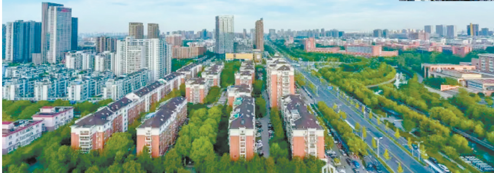
钱塘持续推进产城融合,提高城市宜居宜业宜学宜游水平。

今年一季度,钱塘新区实现制造业投资46.3亿元,同比增长71.5%,投资总量居杭州第一;完成签约亿元以上产业项目23个,总投资106亿元。在最新公布的全省一季度投资“赛马”激励结果中,钱塘区作为杭州市唯一区(县、市)上榜。