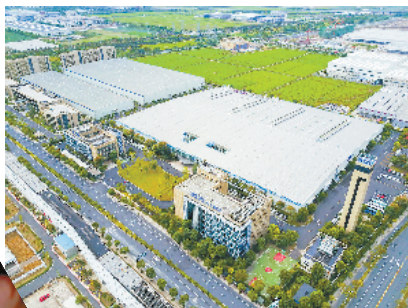
钱塘新区已集聚生物医药、航空航天、半导体、智能汽车与智能装备、新材料五大主导产业

开放,从钱塘区委区政府主要负责人最近的调研行程中就能窥见:3月,赴日本拜访旭化成集团、日本磁性技术控股公司、横滨株式会社等企业;4月,赴北京青岛寻求合作机遇,走访中国航空制造技术研究院、海信集团等机构企业;5月,率党政代表团赴苏