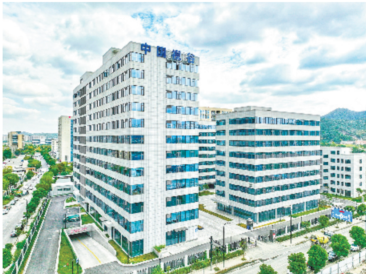
“中国视谷”启动区块

当前,我国正加快建设以实体经济为支撑的现代化产业体系。作为全国十强城市、浙江省会,杭州正高水平重塑“全国数字经济第一城”,全力推进制造业高质量发展,铸就实体经济的铁柱钢梁。