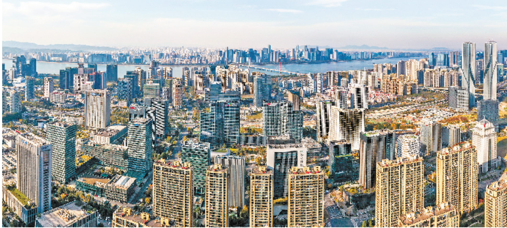
杭州高新区(滨江)集聚众多高新制造企业