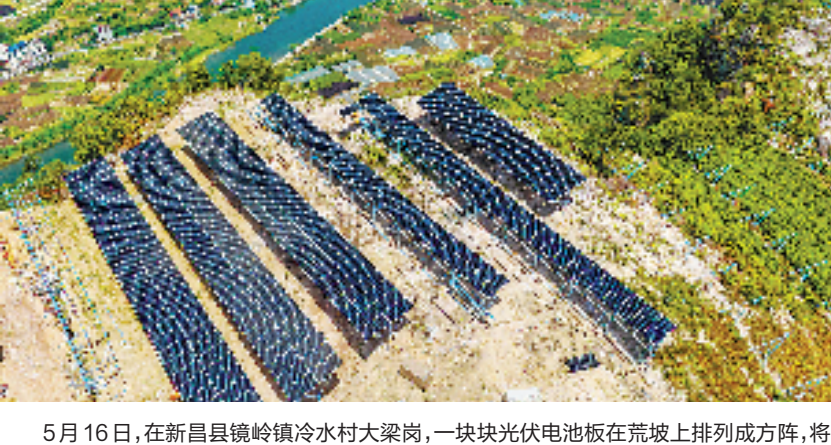
5月16日,在新昌县镜岭镇冷水村大梁岗,一块块光伏电池板在荒山上排列成方阵,将荒山覆盖。国网新昌县供电公司充分开发利用荒山、水库、山林、厂房屋顶等资源发展光伏产业,保障迎峰度夏期间稳定供电。

业主人住为什么要先上课?上虞区以微治理为切口,搭建起社区、业委会、物业三方协同共治平台,创新开展针对小区治理主体的“入住第一课”培训。据社区反映,培训之前小区不少住户在装修中出现违规情况,造成邻里纠纷。通过培训,业主树立规范意识,邻里矛盾明显减少。同时,业委会成员在培训之后对业委会运作有了系统性了解,有力推动了业委会制度化规范化建设。