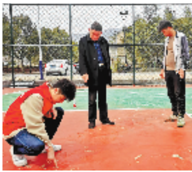
鸬鸟镇监察联络站成员实地察看项目施工情况

来，鸬鸟镇镇村各级纪检监察组织及助企服务专班将继续坚持监督助企、推动实践，紧盯妨碍惠民富民安民、漠视侵害群众利益等问题，保持高压态势，为全面实施乡村振兴战略提供坚强保证。