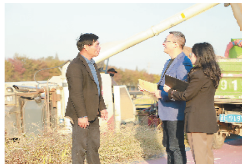
联合检查组与种粮大户交流“非粮化”整治情况

手中有粮，心中不慌。目前八里店镇粮食生产功能区共11666亩，其中“非粮化”整治3424亩，涉及5个行政村，包括旱地、塘坑、苗木等。下一步，该镇将把“非粮化”整治和清廉乡村建设结合起来，切实扛起维护粮食安全使命的担当，以全域监督、精准监督，压紧压实耕地保护、粮食安全主体责任和监督责任，切实守护老百姓的粮仓。