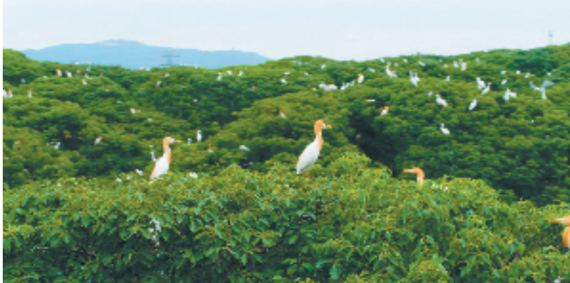
雁荡湿地鹭鸟成群

为在全社会营造全民开展生物多样性保护的良好氛围，萧山区将雁荡湿地设为区级湿地科普宣教基地，分别设置科普宣传栏，设立保护鸟类、禁止猎捕警示牌，以及多个亲水观鸟点。同时以世界水日、中国水周、爱鸟周、野生动植物保护宣传月、世界湿地日等为契机，开展