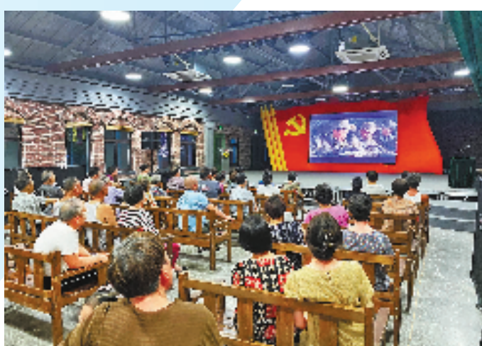
浙江公益电影放映活动现场