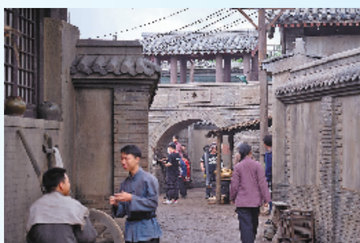
电影剧组在横店影视城拍摄