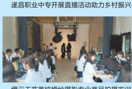
缙云工艺美术校婚纱摄影专业商品拍摄实训