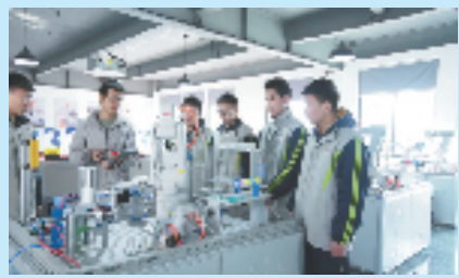
龙泉中职校工业机器人专业教学实训