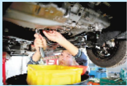
缙云职业中专汽车运用与维修专业学生在现代学徒制合作企业开展顶岗实习