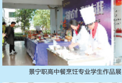
景宁职高中餐烹饪专业学生作品展