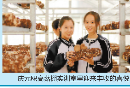
庆元职高菇棚实训室里迎来丰收的喜悦