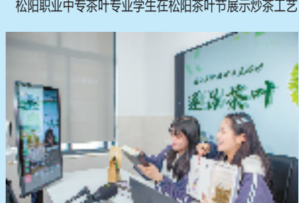
遂昌职业中专开展直播活动助力乡村振兴