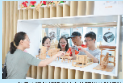
省级木玩创新服务综合体研学体验活动