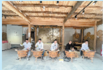
松阳职业中专茶叶专业学生在松阳茶叶节展示炒茶工艺