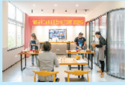
青田县第二届职业技能大赛“咖啡师”项目竞赛现场