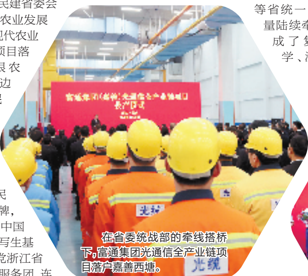
在省委统战部的牵线搭桥下,富通集团光通信全产业链项目落户嘉善西塘。

在民进浙江省委助推下,嘉善民进开明画院揭牌,中国美术学院中国画系花鸟专业写生基地落地;致公党浙江省委组织专家服务团,连续两年到嘉善开展助村活动。