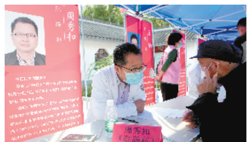
民主党派医疗专家进村义诊