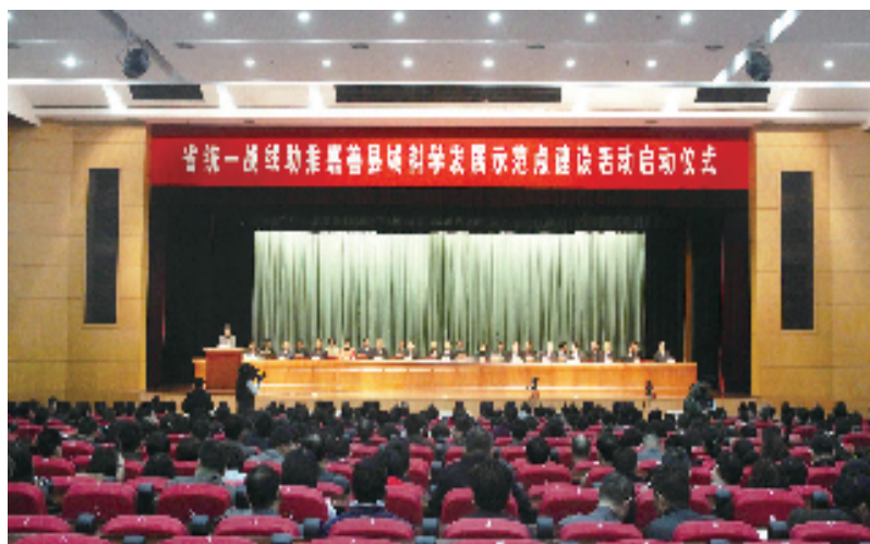
2013年3月23日,浙江省统一战线助推嘉善县域科学发展示范点建设论坛举行现场