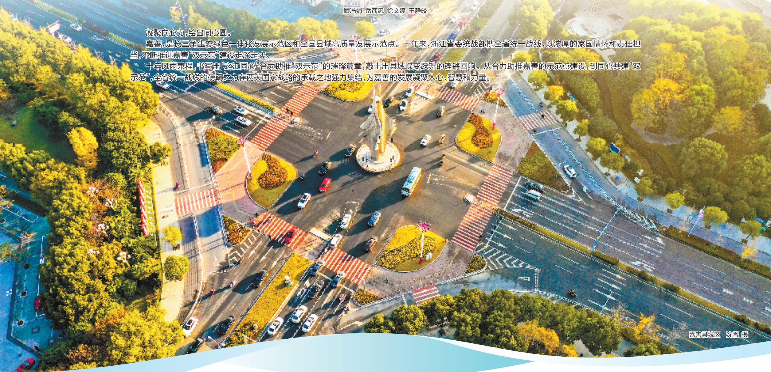
嘉善县城区

十年风雨兼程,书写出“之江同心”合力助推“双示范”的璀璨篇章,敲击出县域蝶变跃升的铿锵回响。从合力助推嘉善的示范点建设,到同心共建“双示范”,全省统一战线的磅礴之力在两大国家战略的承载之地强力集结,为嘉善的发展凝聚人心、智慧和力量。