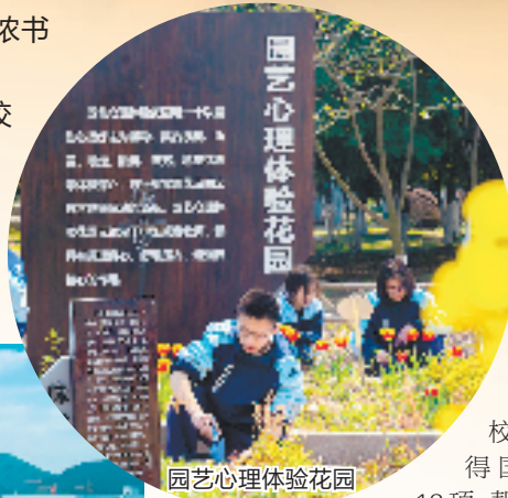
园艺心理体验花园