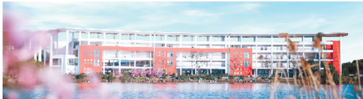
春和景明,校园美如画。

2021年,学校开启“双高”项目建设的新征程,以“立德树人”为根本任务,以“服务发展”为根本宗旨,主动对接湖州现代化产业布局以及湖州市文旅产业“十四五”规划发展需求,提升高素质技能人才培养质量,奋力打造太湖南岸美的摇篮。