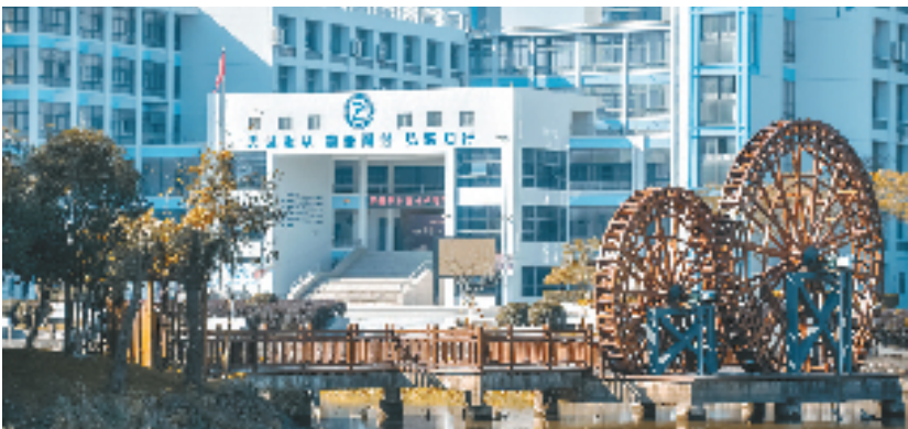
校园一景;子母水车

这是该校“骆驼公益”志愿服务的日常活动之一。长期以来,学校积极落实“三全育人”长效机制,在文化品牌工程建设领域取得了丰硕的成果:“骆驼公益”志愿服务活动获选浙江省中职质量提升行动计划德育品牌、省中小学劳动教育试点项目;“驼群乐学”阅读节获选省中职质量提升行动计划德育品牌;“助学·筑梦·铸人”活动获选省资助文化精品项目。同时,学校还开设了“弘毅长跑管理系统”和“园艺心理”劳动教