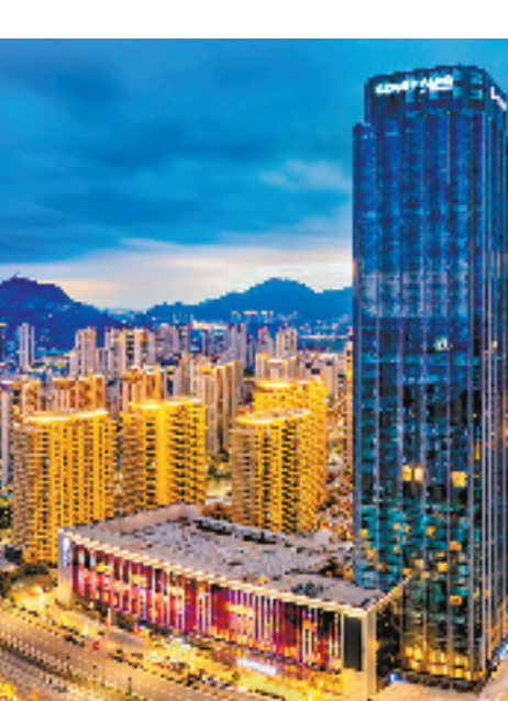
商圈夜景

将实现N个应用的集成，对接乐清本地所有经济平台与日常政务服务窗口，以及本地便民生活服务平台，实现各类场景化应用“一端”集成，在一个平台内满足居民们的多种服务需求。