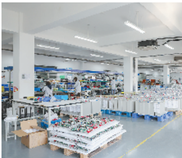
杭州市萧山区义桥镇高新企业生产车间

一年春作首，万事行则至。一季度经济良好运行，为实现全年经济高质量发展起了好步、开了好头。从春天出发，义桥镇将通过全域推进腾笼换鸟、持续发力双招双引、全面服务助企纾困等手段，继续夯实经济发展基本盘，激活高质量发展新动能，坚定不移朝着全年目标任务扎实奋进。