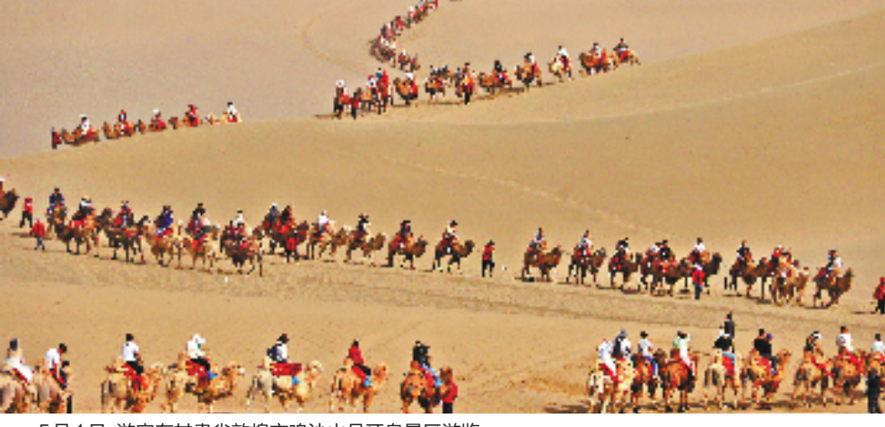
5月1日，游客在甘肃省敦煌市鸣沙山月牙泉景区游览。