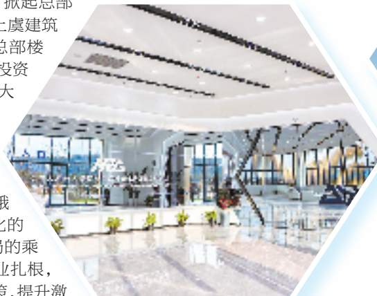
哈工大机器人集团长三角中心(杭州湾)科创城