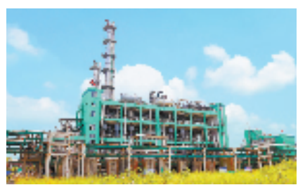
闰土生态工业园区新材料混二氯苯车间

作为“中国乡贤文化之乡”,上虞乡贤资源丰富,他们发挥资源、人脉优势,积极为上虞发展牵线搭桥、献计出力、招商引资……如藤蔓开枝散叶,敞开了上虞“地瓜经济”的又一扇大门。