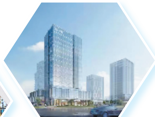
舜德总部大楼复兴大厦效果图