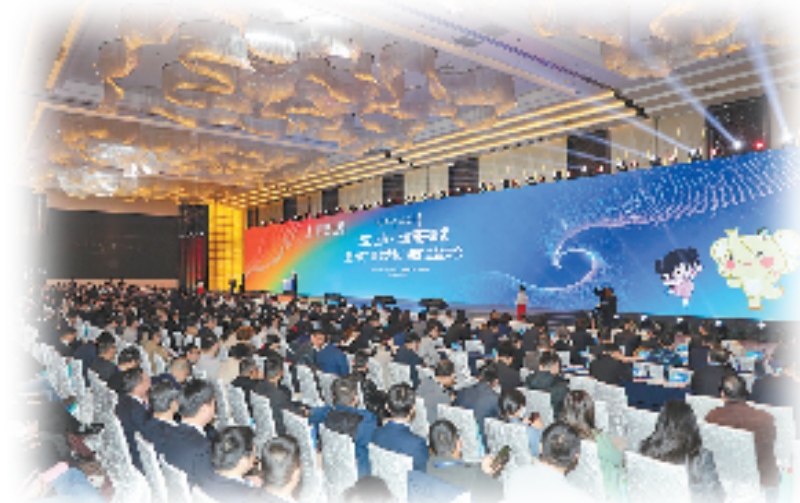
2023上海·上虞周开幕式暨上虞“青春之城”接沪主旨大会

总部企业纷纷落户曹娥江畔,带来的不仅是全球化的视野与活力,还有产业布局的乘数效应。为进一步鼓励企业扎根,上虞区还推出相关扶持政策,提升激励幅度,完善配套建设,不断做大做强总部经济,积极打造更具韧性、活力、竞争力的“地瓜经济”。让“地瓜经济”的“根基”深植虞舜大地。