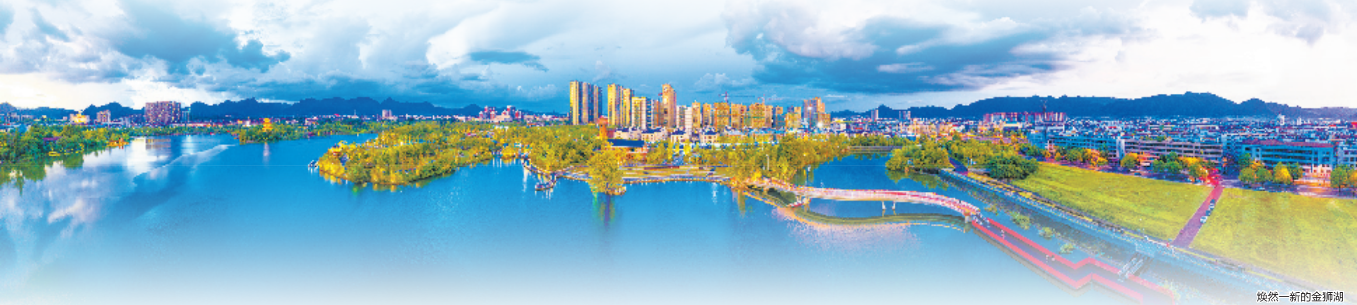
焕然一新的金狮湖

叙桑梓情怀,谋家乡发展。历史翻开新的篇章,200多位乡贤即将回到浦江,共话出发的地方,共谋新篇章。