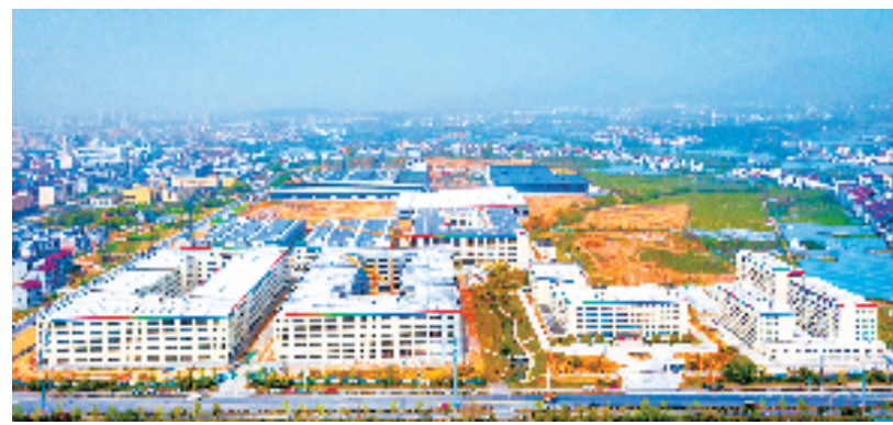
几大光伏光电企业聚集于浦江经济开发区

3月8日,浦江与欣旺达集团旗下子公司签约了3个新能源项目。其中总投资52亿元的盈旺新能源精密结构件项目签约落地浦江,实现了浦江50亿元以上制造业项目的“零突破”,开启了浦江培育打造智能装备制造百亿级产业集群的新篇章。该项目计划建设345亩新能源精密结构件生产基地,制造新能源电池精密结构件及3C消费类精密结构件。