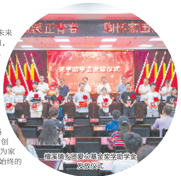
檀溪镇乡贤爱心基金奖助学金发放仪式

此外,本届乡贤大会还将举办浦江战略性新兴产业高层次人才创业大赛、“百才揭榜 我为家乡做件事”等贯穿大会始终的活动。