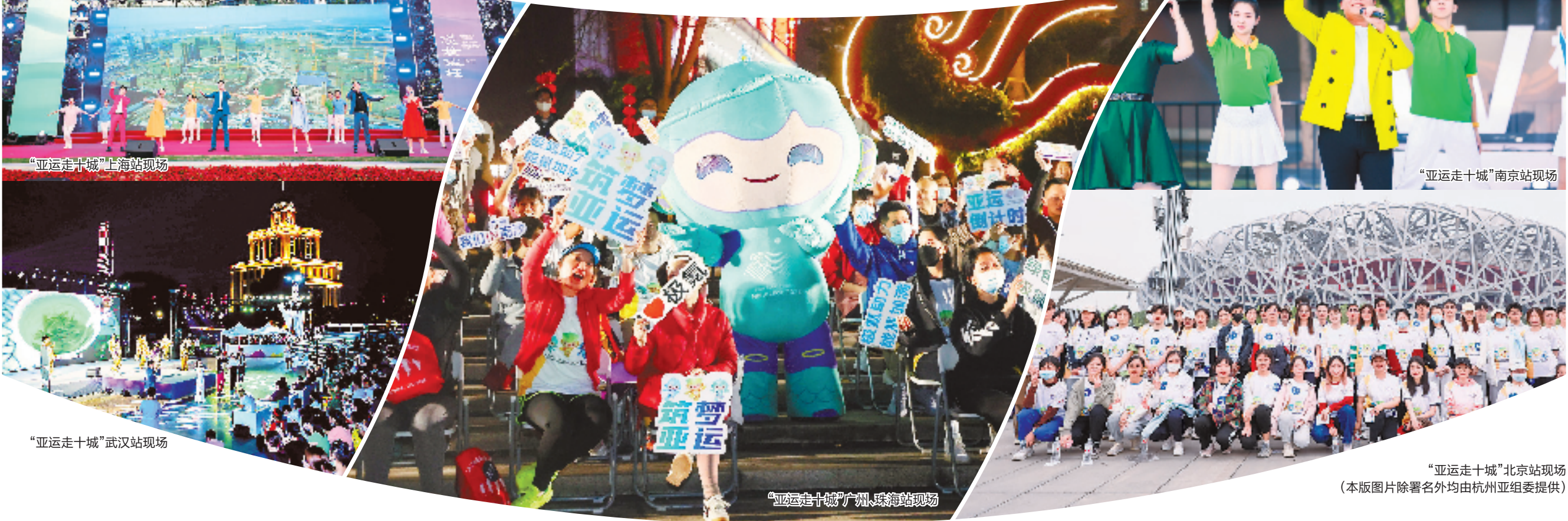
“亚运走十城”上海站现场

距离杭州亚运会开幕还有不到5个月的时间,亚运宣传活动开始加速,亚运氛围日渐浓厚—— 4月22日,“亚运唱十城”系列音乐节首站在温岭启动;4月27日,持续开展近两年的“亚运走十城”活动收官,杭州与“双奥之城”北京开启交流对话。当晚,杭州亚运会官方主题推广曲《有你有我》发布,让全国人民共同参与亚运的火热激情不断被激发;后续,亚运形象宣传片等也将发布。