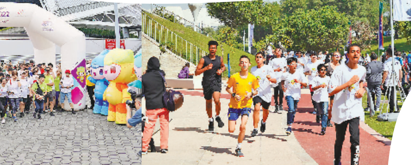
“迎杭州亚运会趣味跑”卡塔尔站现场