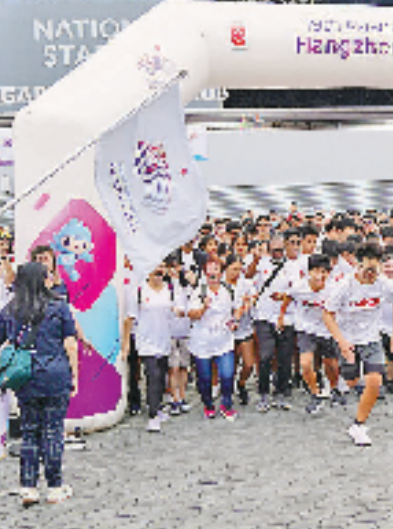
“迎杭州亚运会趣味跑”新加坡站现场

来自浙江大学、浙江传媒学院、浙江育英职业技术学院、浙江经济职业技术学院、浙江建设职业技术学院、浙江交通职业技术学院等6所高校的617名志愿者,参加了为期4天的专项培训。接下来,这些志愿者将为各类赛事提供志愿服务。 (本报记者 林婧 张梦月)