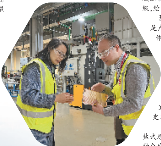
武原街道办事处干部走访企业