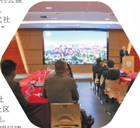
武原商会座谈交流会