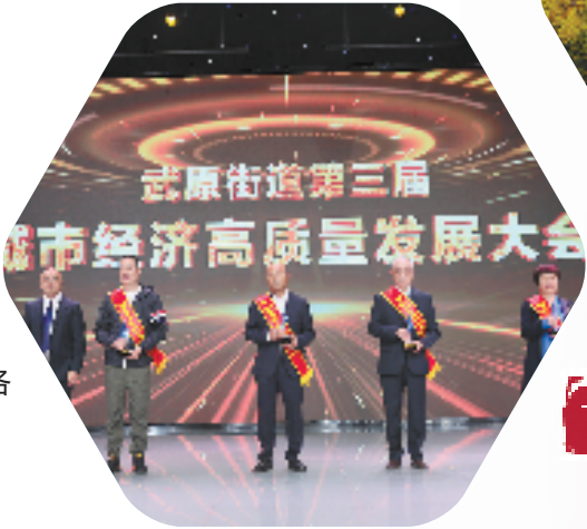
武原街道第三届城市经济高质量发展大会

产业与城市融合共生的发展模式越来越成为新型工业化、城镇化建设的重要导向,成为完善产业结构布局、促进区域协调发展的重要举措。近年来,海盐武原街道围绕建设产城融合活力城市,推进产业结构、城市功能、文化建设提质升级,绘就了三张产城融合发展的品质画卷。 聚焦以产兴城,绘就产业升级“经济卷”。完善产业结构是产城融合发展的基础,构建支撑高质量发展的现代产业体系,将打造一流营商环境作为投资兴业的“梧桐树”和“吸铁石”。 着力以城聚人,绘就宜居宜业“民生卷”。增进民生福祉是产城融合发展的根本,“产”与“城”的相互协同是以“人”作为联结点,同时产城融合还是软实力相互内嵌、相互借力的长期过程。 活化古城文旅,绘就全域美丽“文化卷”。因地制宜、走特色化发展道路是产城融合发展的关键,深挖历史文化脉络,留住乡愁古韵,焕发活力新生。 行棋观大势,落子谋全局。在转型升级的新征程上,海盐武原街道以产兴城、以城聚人、以文化人、以人兴业,以产城融合发展模式推进中国式现代化在江南古城的生动实践,实现“产—城—人”的三向奔赴。