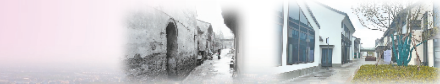
武原街道北大街改造前