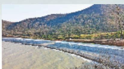
日岙村卵石滩的新建堤坝将减少水土流失,促进海岸线的生态可持续性。

就在2021年,这座从山水画中走出来的海岛之城,拿下了由中央财政补助的国家级海洋生态保护修复项目,包括对当地东部砂砾质岸线、海堤生态化以及乐清湾红树林进行全面生态修复。如今,从鸡山到洋屿,从五门到鲜叠,从一颗颗卵石到一处处沙滩,从一片片红树林到一座座新堤坝,数十公里的海岸线修复,正从一点一滴的量变逐步升级为绿岛蓝湾的蝶变。