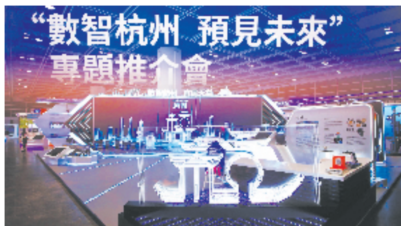
杭州市组织企业赴香港参加国际创科展

市区两级联动，外资招引也实现开门红。一季度，杭州全市招引投资总额3000万美元以上大项目29个，涉及投资总额40.21亿美元，合同外资15.39亿美元。截至目前，累计有134家世界500强企业在杭州投资了234个项目。