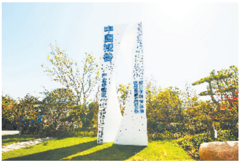
“中国视谷”将打造产业新地标