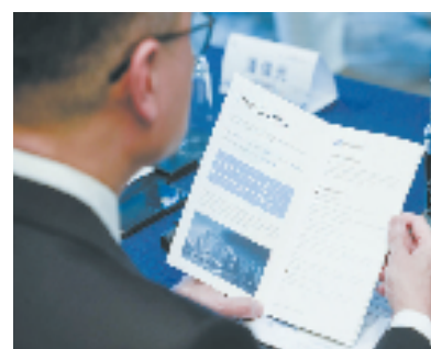
杭州—香港高端服务业推介大会现场

1月9日—13日，杭州—香港招商代表团奔赴香港开展招商引资、投资促进活动； 2月14日—21日，杭州招商代表团赴日本、新加坡开展以生物医药产业为主的投资促进活动； 3月5日—12日，欧洲产业招商团奔赴瑞士、德国开展招商引资、投资促进活动； 3月9日—16日，杭州招商团组赴法国、西班牙开展产业投资促进活动；