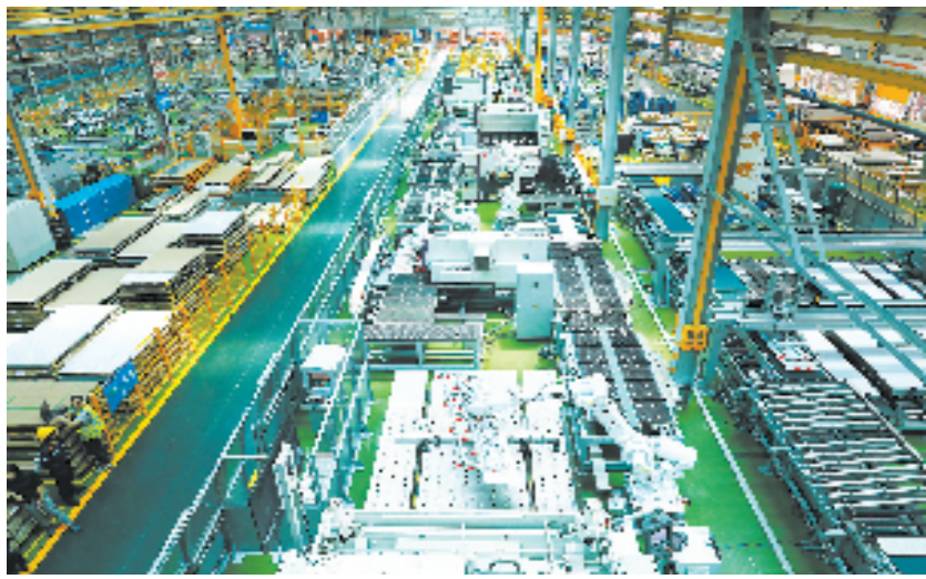
杭州新制造业车间

“杭州的招商引资工作不仅要在数量上实现再增加，在质量方面也要更好。”杭州市投促局相关负责人介绍，围绕五大产业生态圈的目标企业，目前已制定相应比例的目标企业数量考核标准，以保障全市的项目招引聚焦在五大生产圈内的生态企业上。