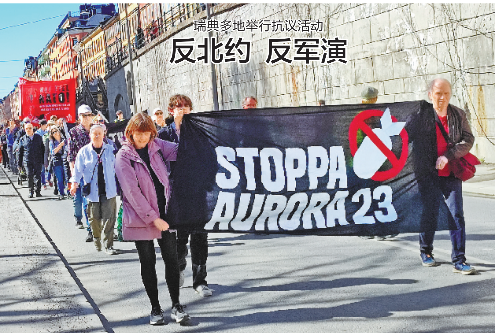
瑞典多地举行抗议活动 反北约 反军演

马里政府还说,军方另外在莫普提区博尼一带消灭大约60名“恐怖分子”,并在库利科罗地区穆尔贾摧毁一处恐怖分子营地。此前,马里军方一支从穆尔贾出发执行补给任务的小队在途中遭遇伏击。 同一天,马里空军一架直升机在巴马科失事,坠入居民区。马里政府说,3名机组人员身亡,6名平民受伤。这架直升机在巴马科上空执行侦察任务。马里政府暂未公布失事原因。 2012年3月,马里发生军事政变。2015年5月,马里政府与北部地区部分武装组织签署和平与和解协议。同年6月,各方完成协议最终签署。然而,马里北部地区近年来冲突不断,中部和南部地区武装袭击也有增多趋势。