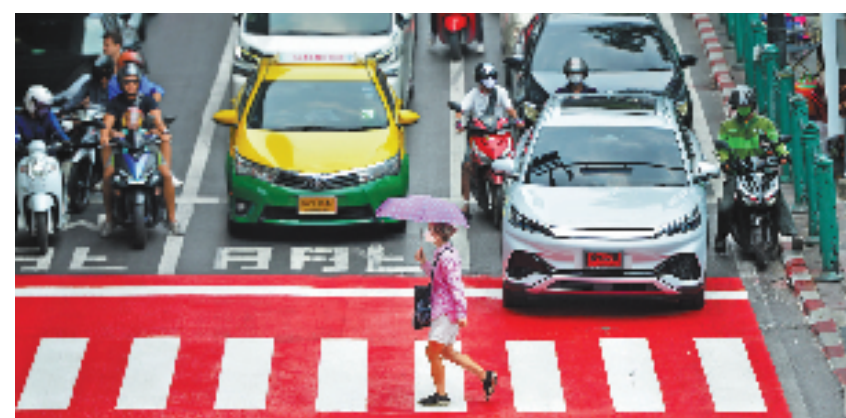
行人在泰国曼谷街头打伞遮阳。