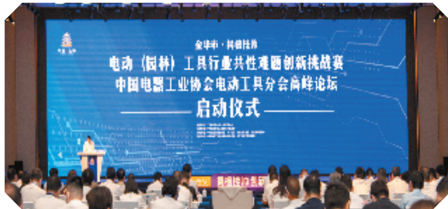
金华举办“揭榜挂帅”电动(园林)工具行业共性难题创新挑战赛

金华素有“小邹鲁”之称，人杰地灵、人才辈出。据不完全统计，现有海内外金华籍高层次人才3万多名，不少人才活跃在时下最热门的新兴产业领域。为进一步发挥“金华籍人才较多的优势”，该市成立了金华海内外人才总会，深化金华籍人才“TOP330”乡情引才工程，建立30名顶尖人才、300名领军人才项目库，累计引进金华籍高层次人才项目160余个、投资额300多亿元。