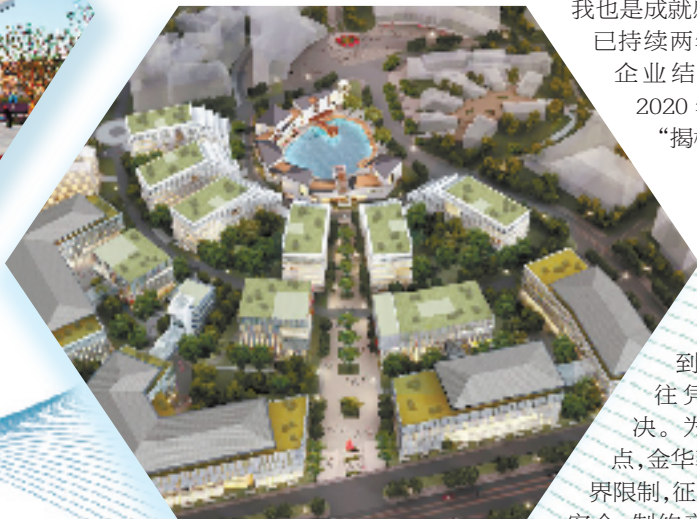
金华双龙人才科创中心