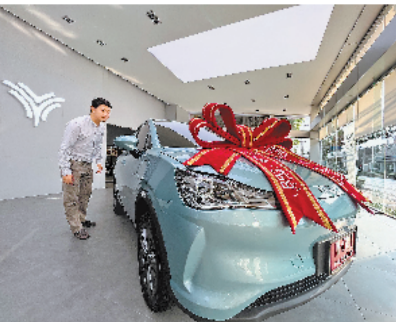
泰国百姓在哪吒汽车泰国4S店挑选新能源汽车。