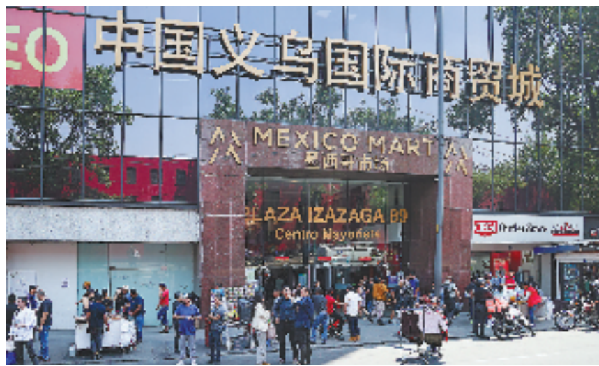
位于墨西哥首都墨西哥市中心的中国义乌国际商贸城。