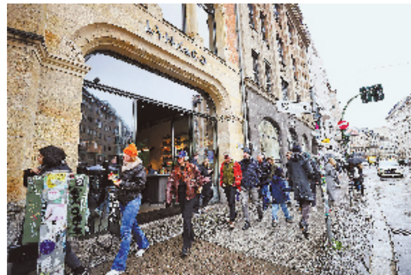
领克柏林体验店外景。