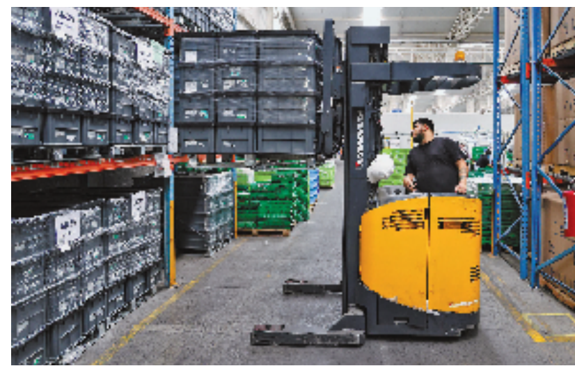
爱柯迪墨西哥工厂,工人正在装卸货物。