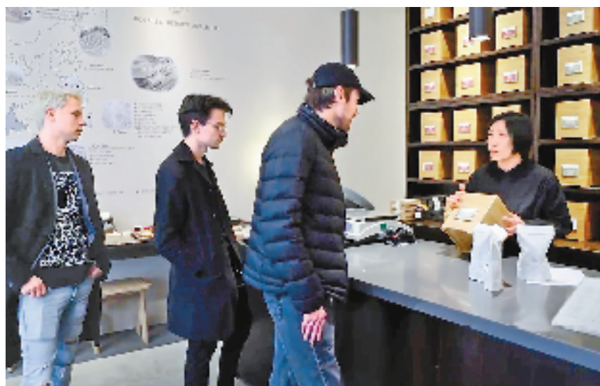
法国巴黎黄土土地中国茶专卖店,几位顾客在购买龙井新茶。