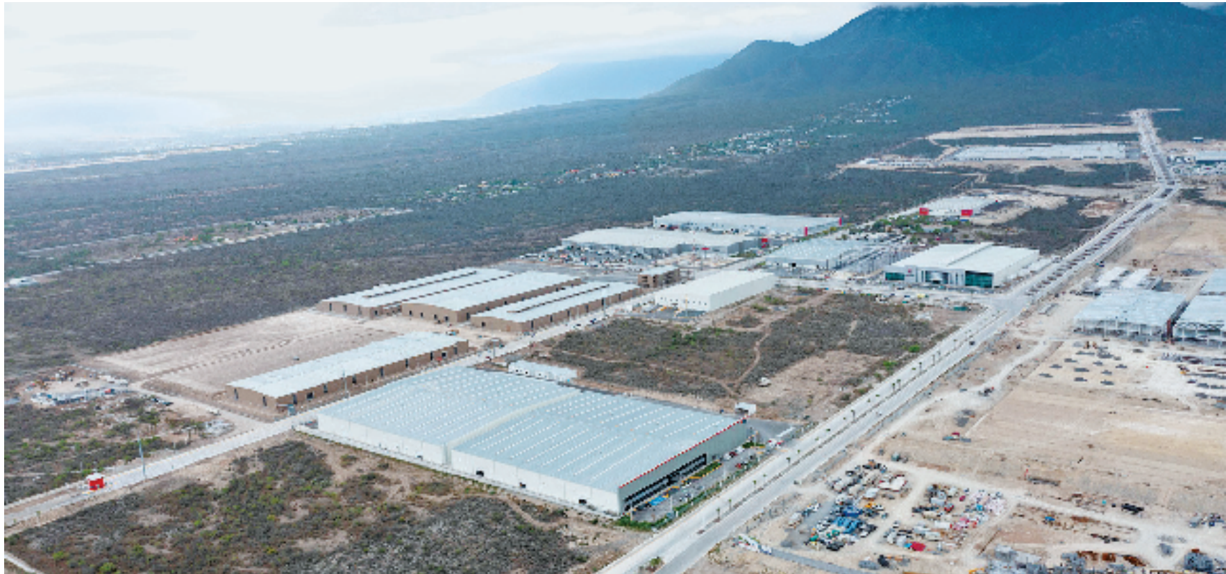
墨西哥新莱昂州蒙特雷市,北美华富山工业园。