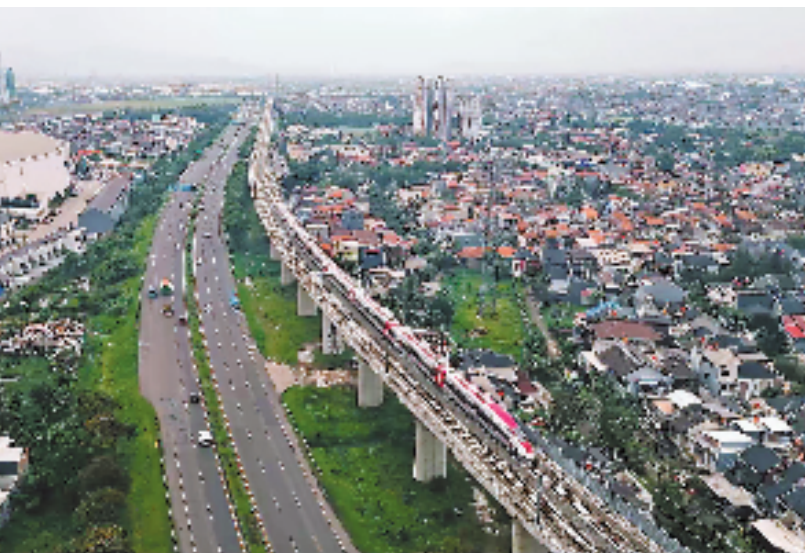
雅万(雅加达—万隆)高铁通车在即,它的背后有许多浙江元素。图为高铁试跑画面。