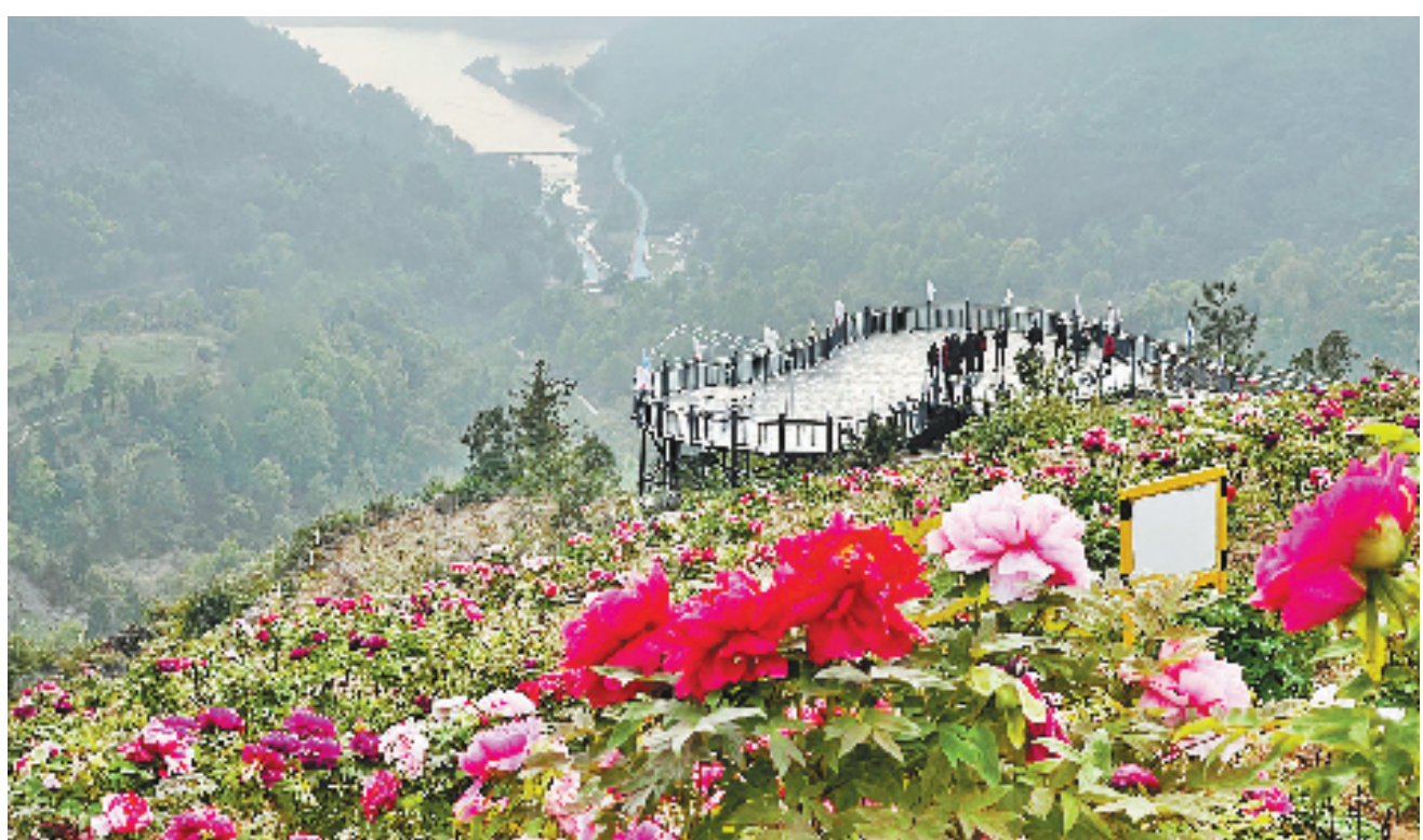
美丽的牡丹园

“今天客人估计要过万,当导游的村民都不够了,早些来支援我们吧。”一大早,我就接到了牡丹园负责人黄宣国的电话。