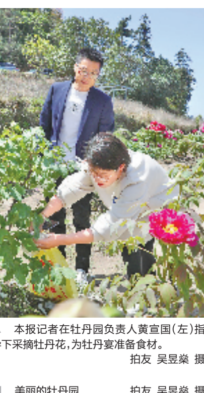
美丽的牡丹园

汁,放入热腾腾的油锅,待包裹花瓣的外层炸至金黄,一盘脆皮牡丹就做好了。我先尝了一口,酥脆的外皮一旦咬开,被锁住的花香突然释放,一下子弥漫口腔,好香好香!