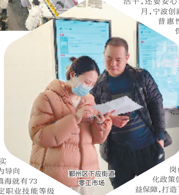
鄞州区下应街道零工市场