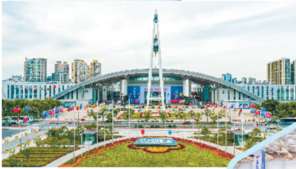
中国—中东欧国家经贸合作示范区

此外，宁波推出促消费的招数还有：打造具有影响力的全国级地标性商圈；加快培育建设一批夜间经济地标商圈、特色街区；不断加大国际品牌的挖掘力度；深度挖掘和保护宁波老字号品牌资源等，希望能让消费场景更“强”、让消费内容更