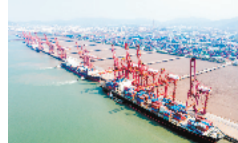
宁波舟山港北仑第一集装箱码头