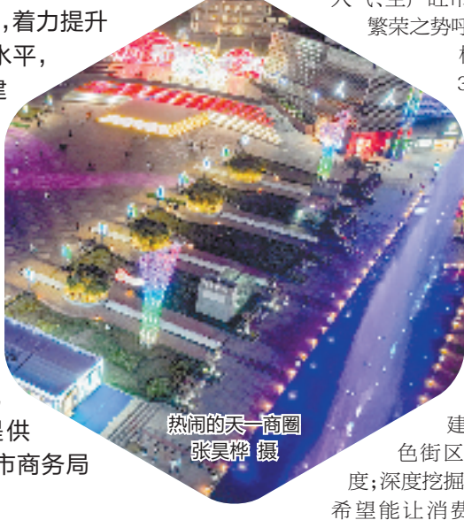
热闹的天一商圈

内外贸易质量和水平，更好地服务构建全方位全要素、高能级高效率的双循环，加快形成更多具有商务辨识度的标志性成果，奋力推动商务经济高质量发展，为打造中国式现代化市域样板提供坚实支撑。”宁波市商务局相关负责人说。