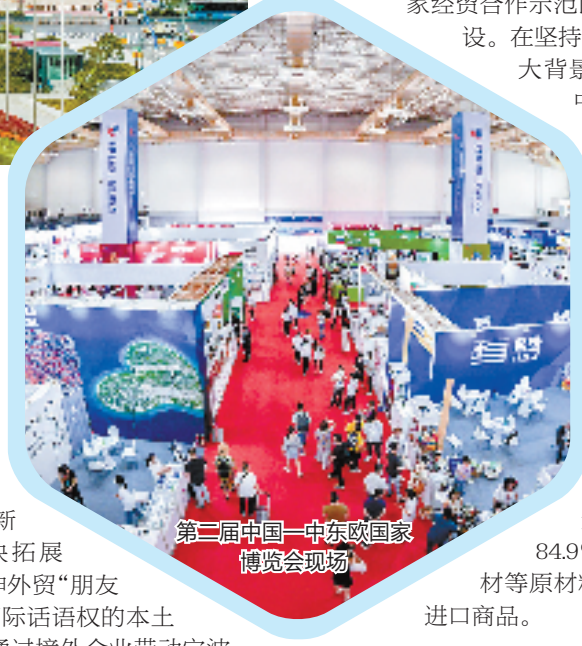
第二届中国—中东欧国家博览会现场

中东欧国家进出口额共计450.4亿美元。其中进口额为111.5亿美元，增长47.5%，首次突破百亿美元大关。今年1月至2月，宁波与中东欧国家经贸往来“开门红”，宁波自中东欧国家进口额达到26.9亿美元，同比大幅增长84.9%。其中，汽车、铜材等原材料及农产品是主要进口商品。