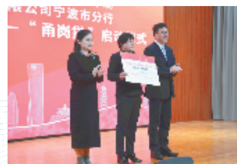
宁波首个稳岗扩岗专项贷款“甬岗贷”发布现场

宁波始终坚持就业优先政策，今年将围绕“最易就业、最有奔头、最优服务和最具安心”目标，千方百计扩大就业容量，努力提升就业质量，全力化解结构性就业矛盾，切实防范规模性失业风险，着力打造高质量充分就业创新城市。一季度全市城镇新增就业6.37万人，就业形势基本稳定。