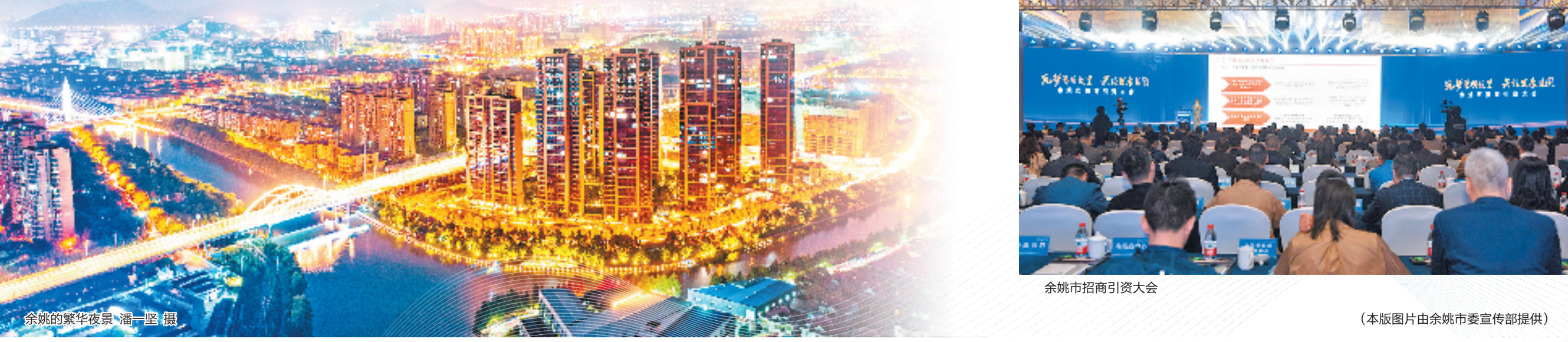
余姚市招商引资大会