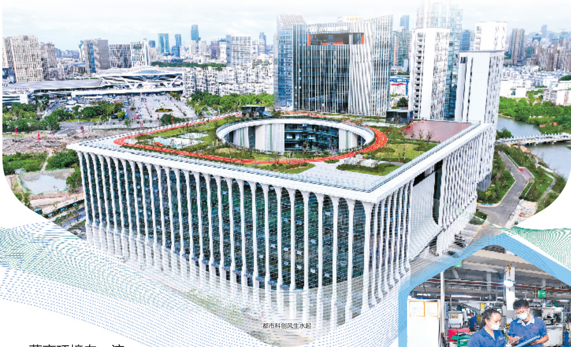
都市科创风生水起