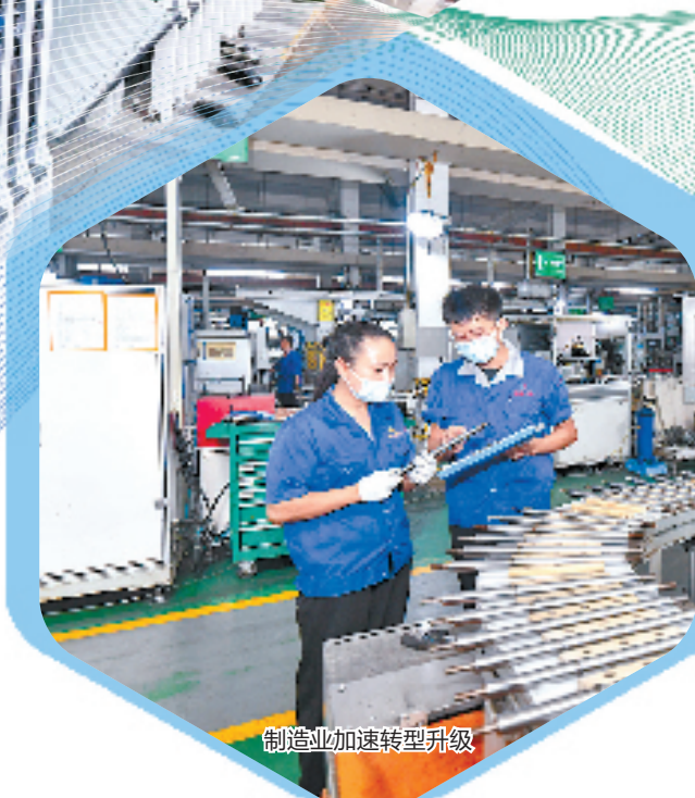
制造业加速转型升级