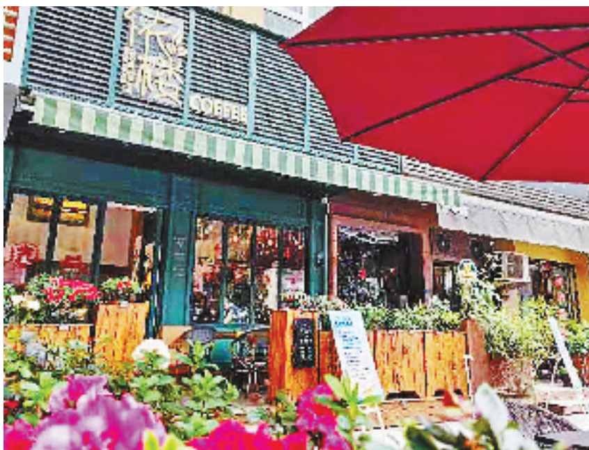
在温州丽吞咖啡一条街上，一家咖啡店正在营业。