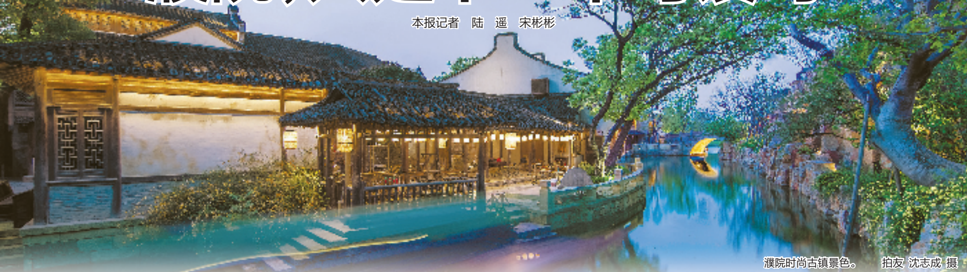
濮院时尚古镇景色。