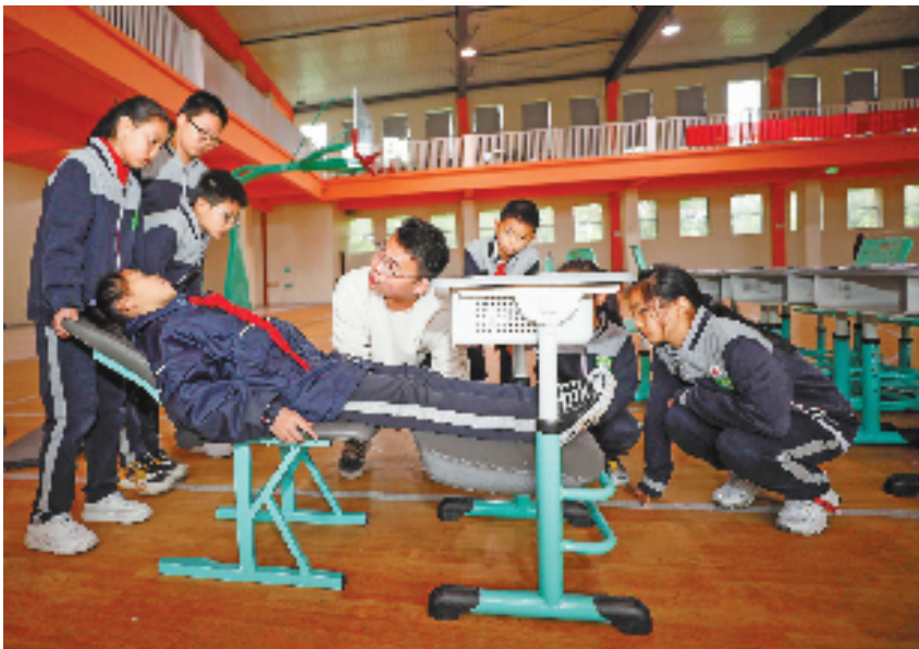
安吉第七小学的同学们在老师的带领下调试午休桌椅。