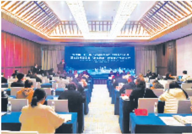
“外贸服务月”宣讲会现场

今年以来,中行金华市分行积极响应金华银保监分局、商务局、人行外管等部门号召,服务企业、帮助企业进一步做好汇率风险管理、积极宣导树立“汇率风险中性”意识,切实提高企业汇率避险服务水平、合计主办或承办汇率避险讲座