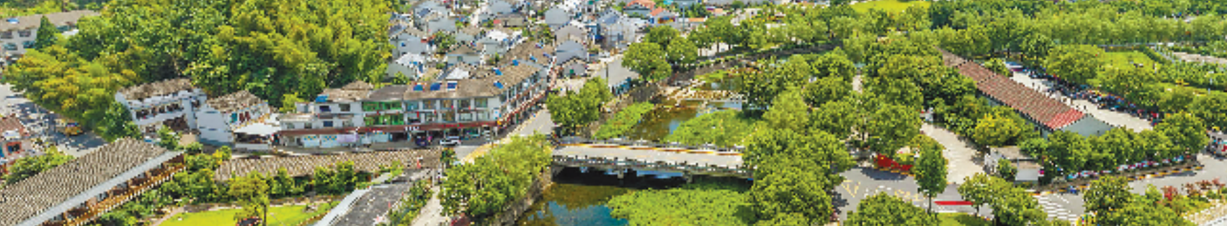
美丽的横坎头村