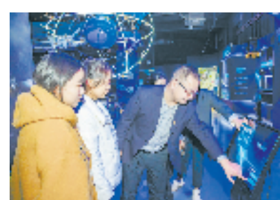
独山港镇年轻干部参观航天清风馆,感悟航天精神。

春风化雨间润物无声,为进一步推动红色廉洁文化“飞入寻常百姓家”,该市还瞄准不同群体,组织开展讲述英烈故事、寻找乡愁记忆等活动;摄制红色廉洁文化系列视频,在全市各大户外显示屏滚动播放;赋予平湖西瓜灯、平湖粽子书、平湖派琵琶等传统文化以红色廉洁文化内涵……通过不断丰富教育形式,让红色廉洁文化成为党员干部和人民群众的精神归属,全力营造良好的政治生态。