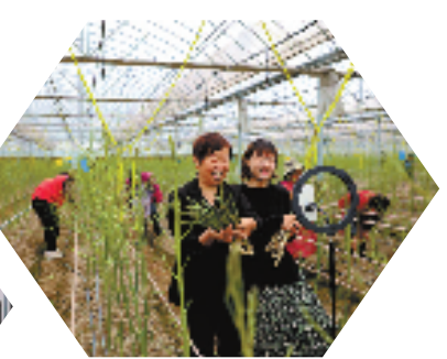
和平镇长城村组织党员志愿者、乡贤帮扶低收入农户销售芦笋。

数据显示，今年以来，和平“招大引强”捷报频传：总投资8000万美元的智能矿山机械设备项目顺利签约，航天国