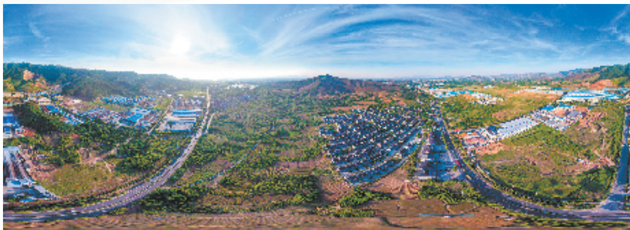
新兴产业集聚和平

华总投资3.55亿元的有机溶剂再生综合利用项目成功落户，浙江珀菲特投资4.5亿元的高性能专用新材料项目签约，总投资1800万美元的无溶剂涂料建设项目正式入驻……截至目前已成功引进固投亿元以上项目8个，总投资40.69亿元。