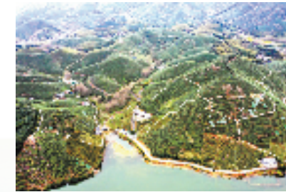
俯瞰和平镇滩龙桥村茶叶采摘区

一年之计在于春，开局起势见精神。接下来，和平镇将继续深入开展“在湖州看见美丽中国”实干争先主题实践，以担当诠释初心、以实干践行使命、以奋斗赢得未来，为高质量发展新时代“经济强镇、富美和平”而不解奋斗。