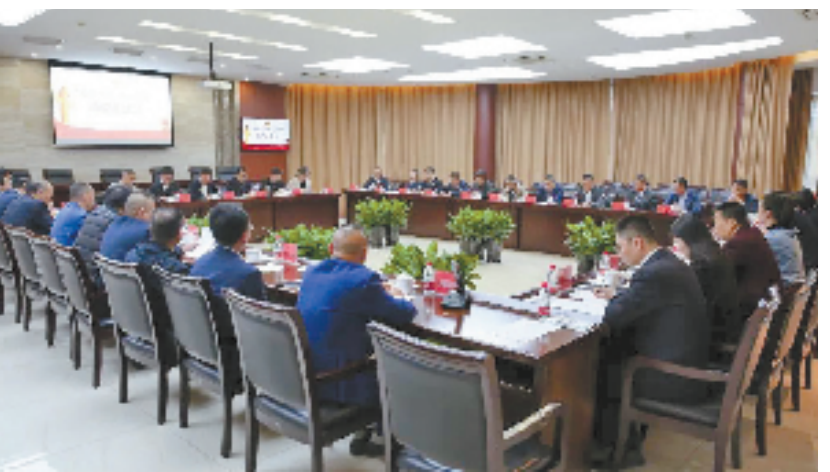
嘉善县检察院邀请企业家参加司法救助检察开放日活动。