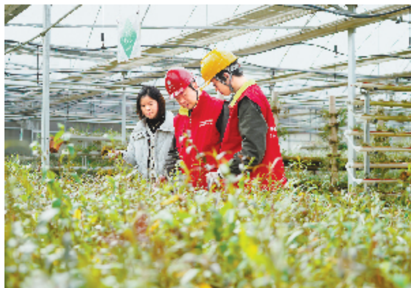
3月27日,国网浙江电力(德清)红船党员服务队上门为德清牧歌生态农业产业园解决温控、照明等设备用电问题,助力石斛产业发展。

今年以来,德清县“绿电”动力引擎持续充能。日前,国网德清县供电公司启动全市首个光伏共富项目,确定在新