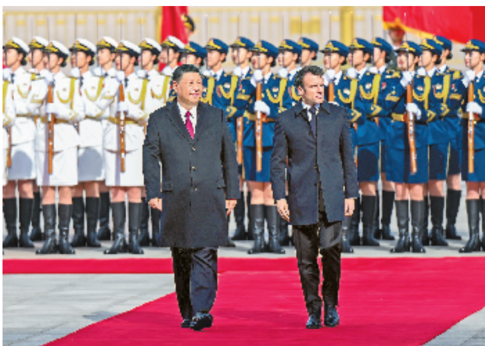
4月6日下午,国家主席习近平在北京人民大会堂同来华进行国事访问的法国总统马克龙举行会谈。这是会谈前,习近平在人民大会堂东门外广场为马克龙举行欢迎仪式。

■ 要增强中欧关系的稳定性。中欧关系不针对、不依附、不受制于第三方。中方始终从战略高度和长远角度看待中欧关系,对欧政策保持稳定性和连续性。希望欧方形成更为独立、客观的对华认知,奉行务实、积极的对华政策。双方要尊重彼此核心利益和重大关切,通过对话协商聚同化异。 ■ 中欧要共同维护世界稳定和繁荣,反对霸权主义、单边主义,反对“脱钩断链”。