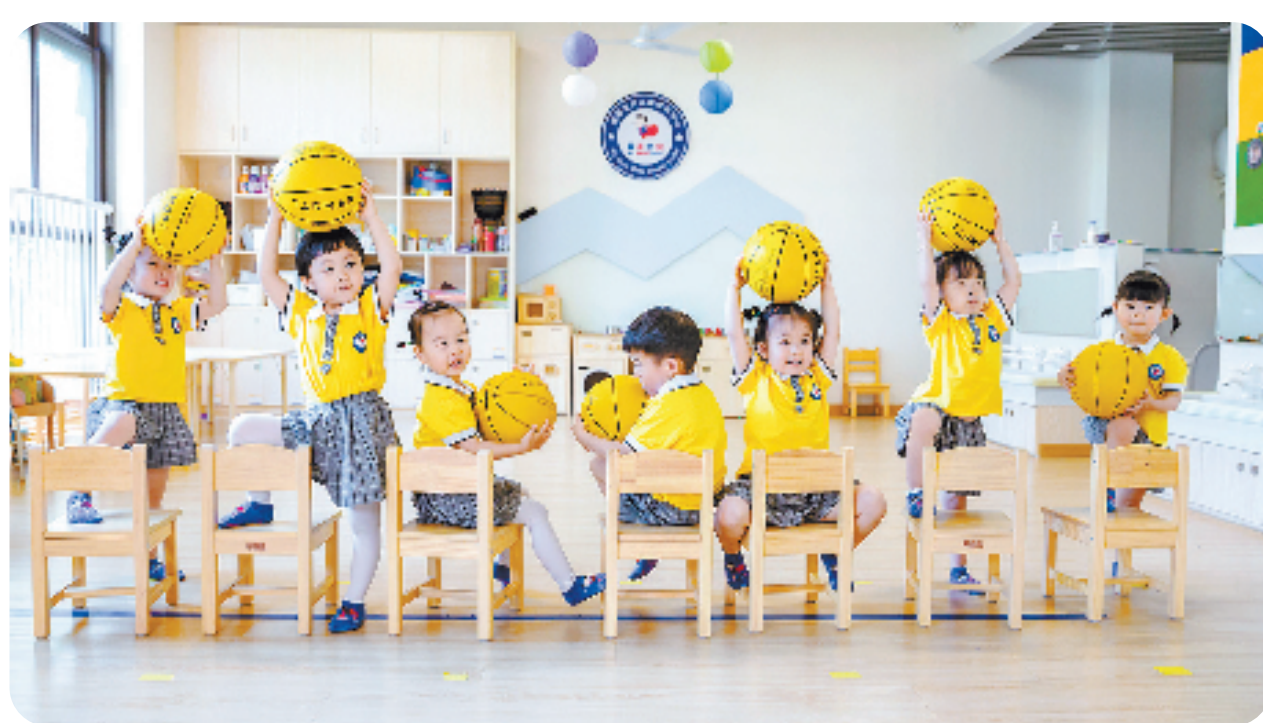
西湖区三墩镇爱心托育园

了“需求端”和“供应端”的不平衡，不断为服务“打补丁”。一方面，将婴幼儿照护服务设施纳入城市规划基本配套，通过算力算法精准匹配需求；另一方面建立符合杭州实际、不同办托主体适用的普惠认定机制和精细化财政补偿机制，保障婴幼儿照护服务机构可健康运营。