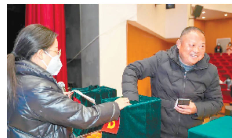
中泰街道石鸽社区新南湖绿苑三期安置房交房现场

中泰街道纪工委相关负责人表示，接下来，街道将继续点对点监督、实打实整治，把群众反映的事项解决好、落实好，以真抓实干的作风努力提升人民群众的满意度和获得感。