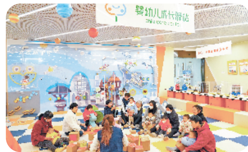
余杭区仓前街道葛巷社区婴幼儿成长驿站

下一步，杭州将着力推动婴幼儿照护服务深度发展，通过在合理增长托位，深化服务内涵，充实服务内容，规范服务市场，深化“数智托育”等方面下功夫，进一步扩大婴幼儿照护服务社会支持度和群众知晓率，擦亮“善育在杭”金名片。